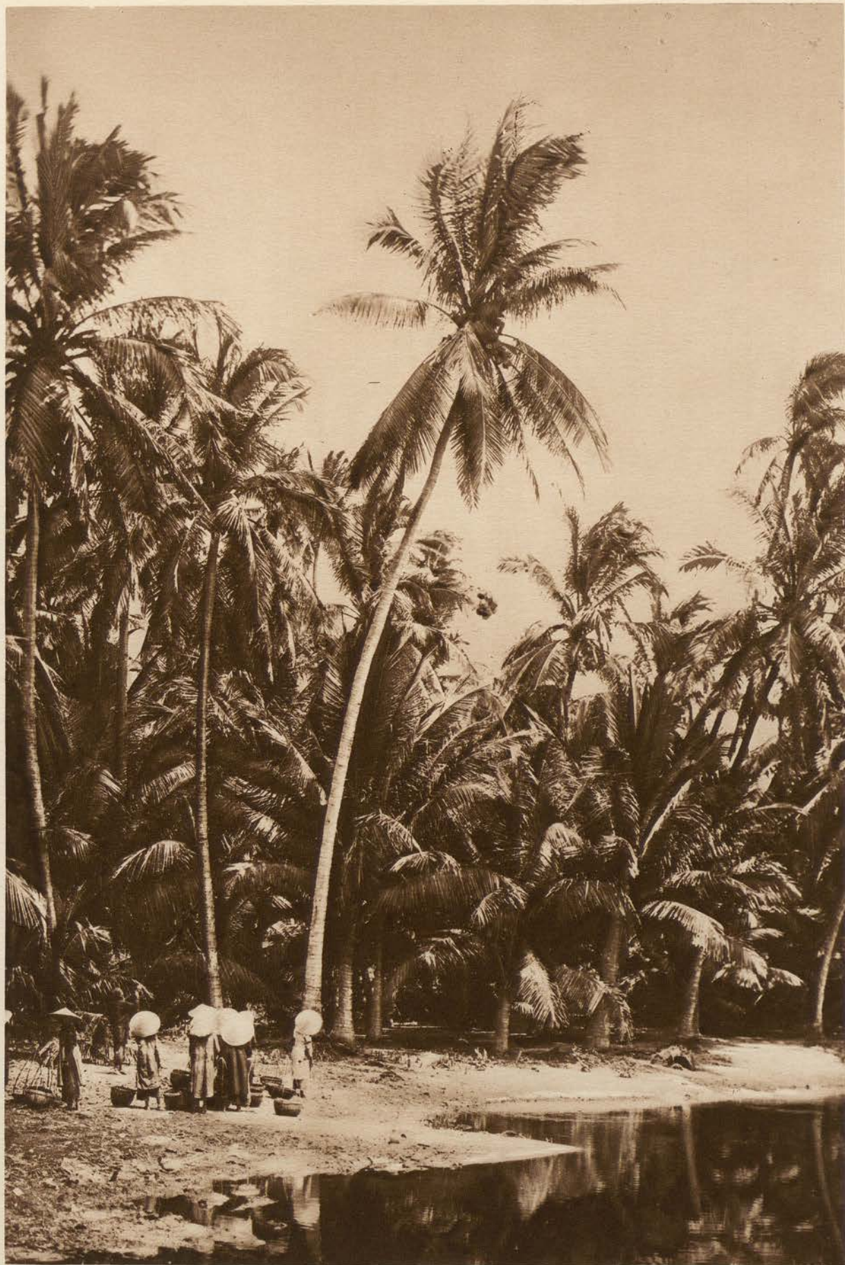
F. C. 734