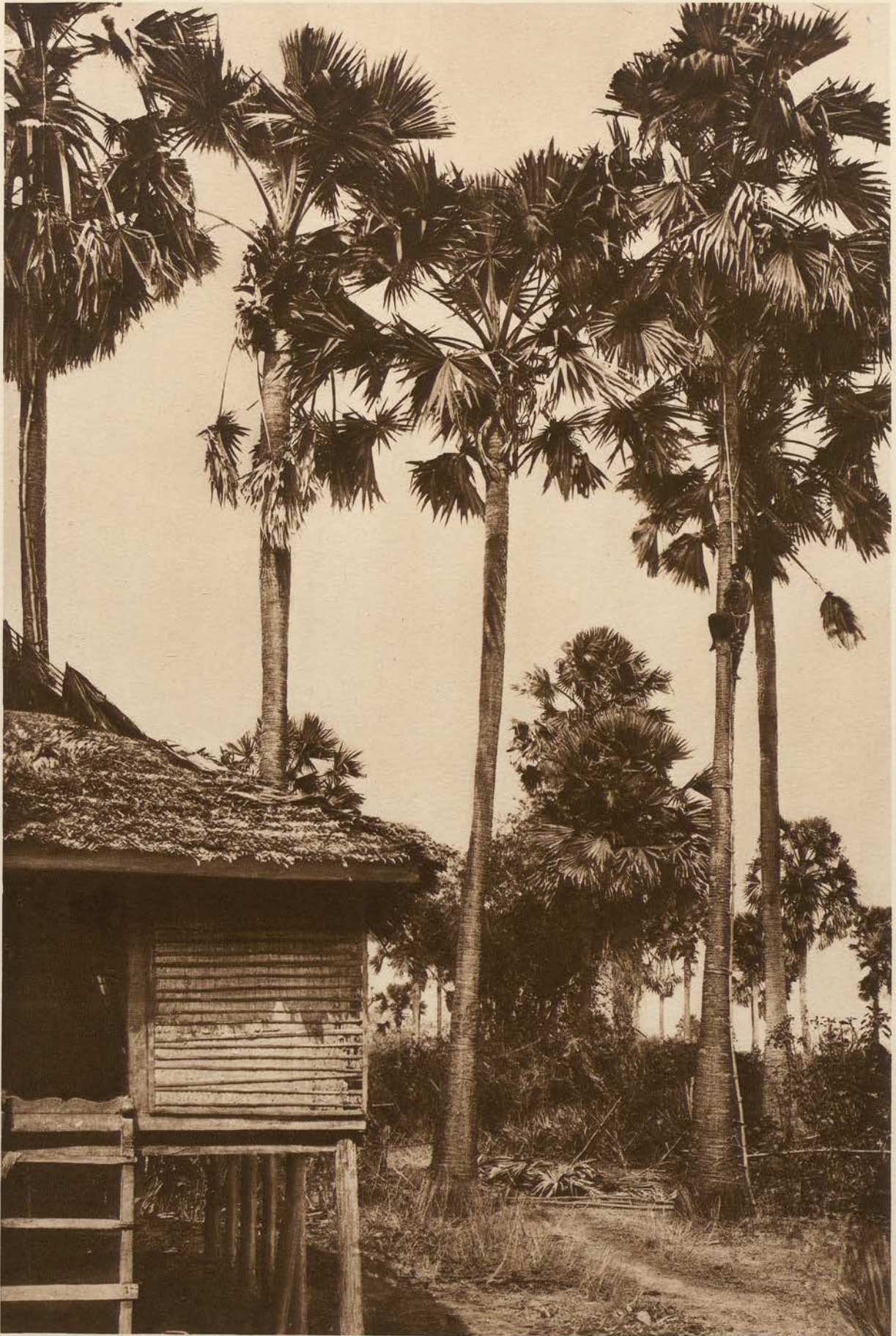
F. C. 747