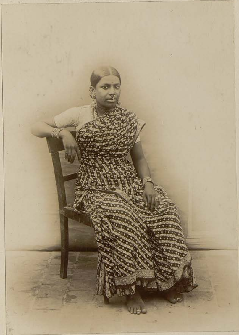
11 Femme indienne