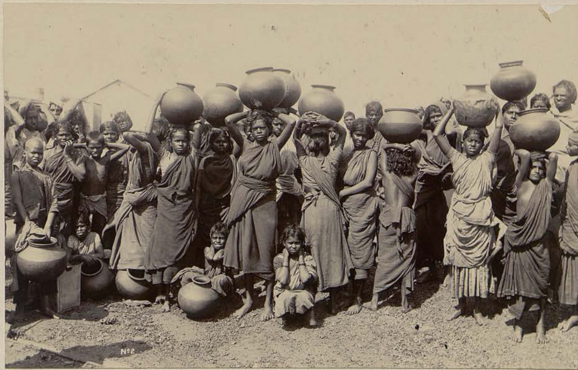
Porteuses de l'eau