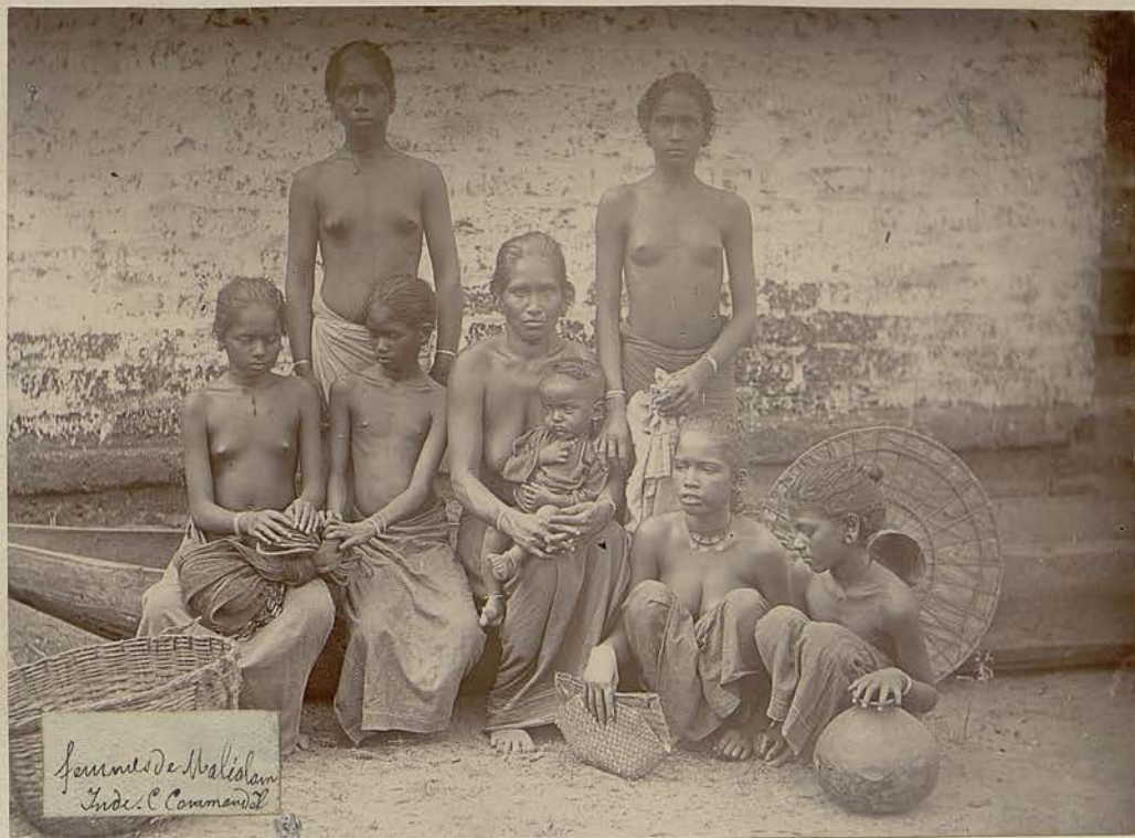
Femmes de Malakal Inde. C. Comandant