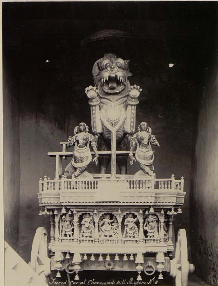
Sacred Car at Charamandi Hill Mysore N° 8