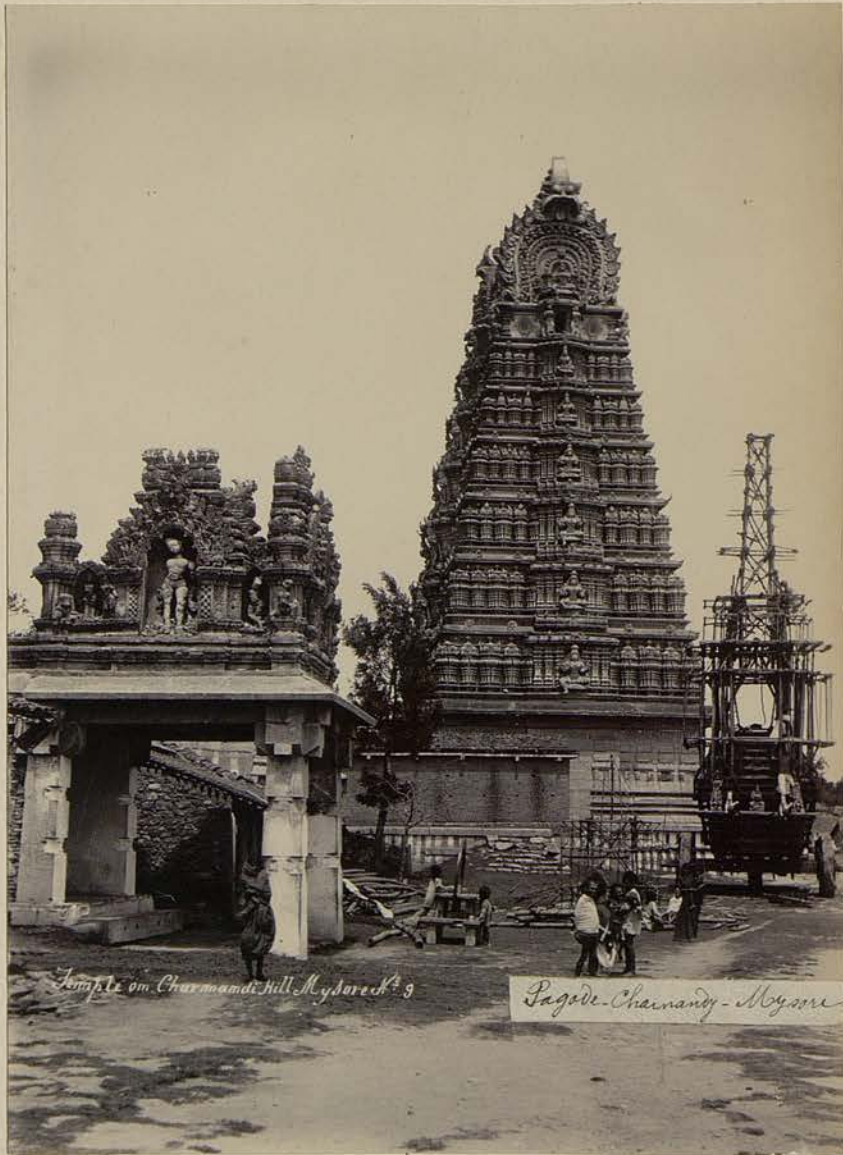
Temple om. Chennarayana Hill Mysore n° 9