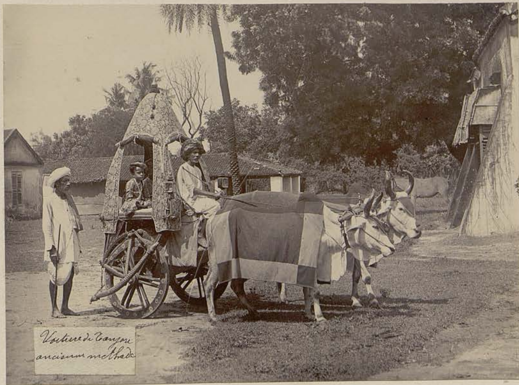
Voiture de Congou ancien au Madag.