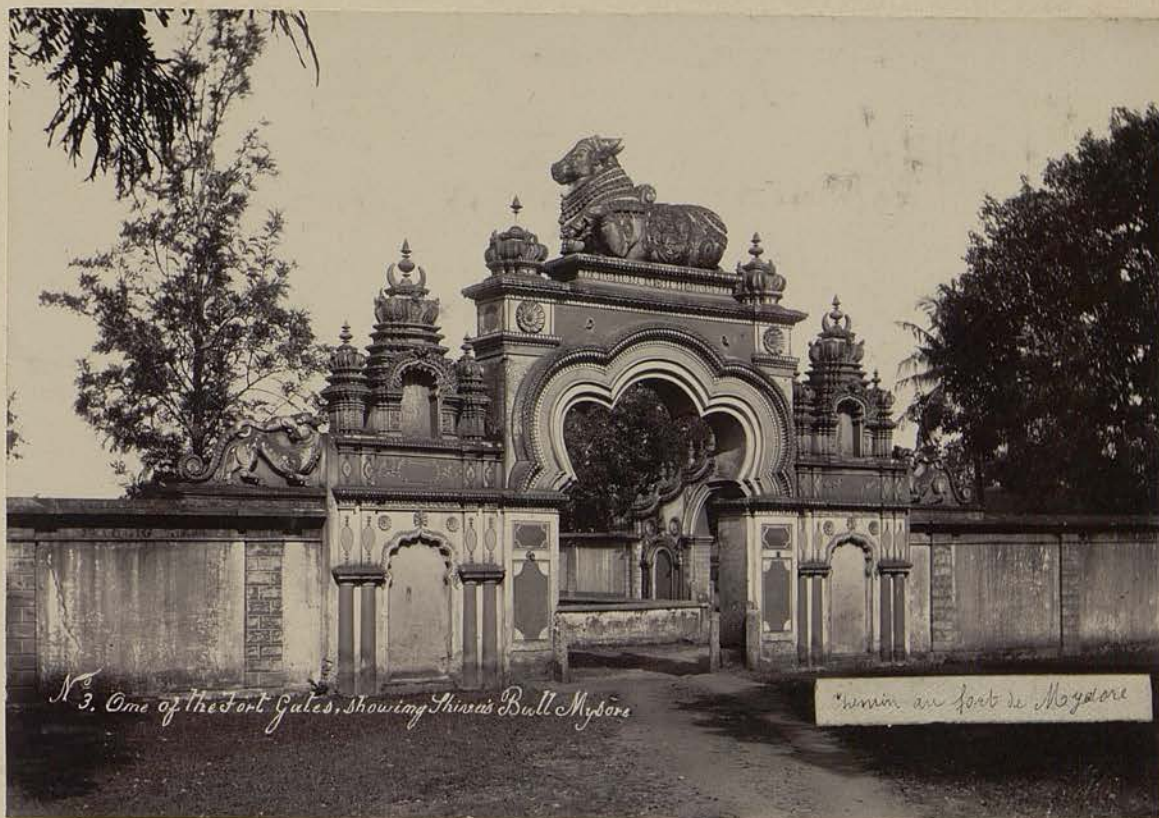
N o 3. One of the Fort Gates, showing Naras Bull Mysore