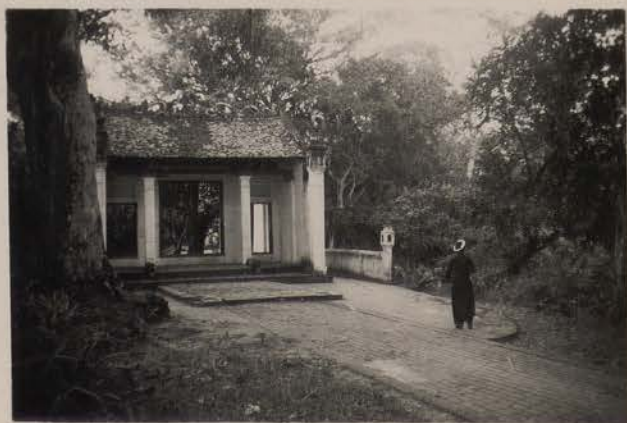
HANOI, 16 décembre 1951.- Pagode de Linh Lang, portique d'entrée.