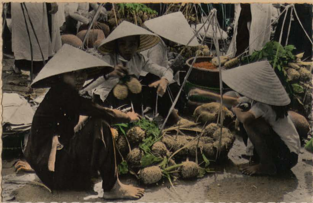
HANOI.- Marchandes de primeurs.