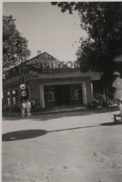
HANOI, septembre 1951.- Un com- merçant chinois. Epicerie, res- taurant, quincaillerie, joaille- rie, horlogerie.