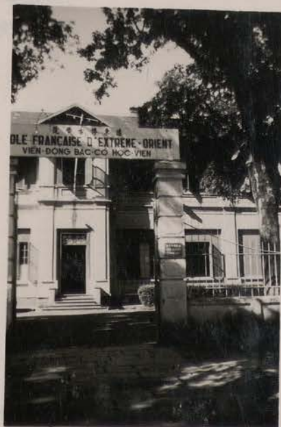
HANOI, août 1951.- L'EFEO (entrée principale).