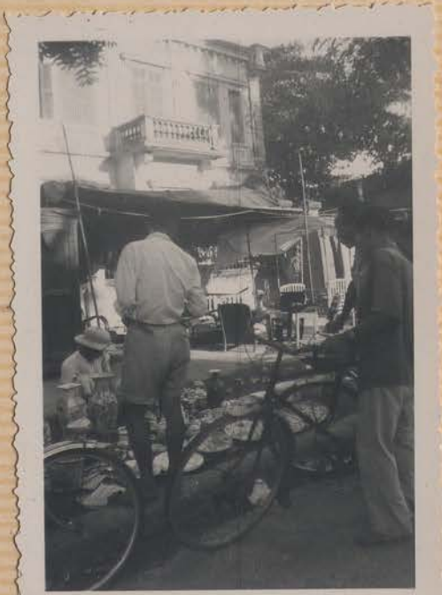
HANOI, septembre 1954.- Petit commerce sur les trottoirs.