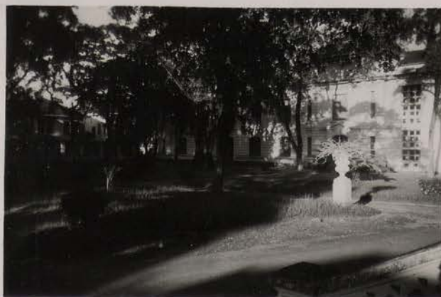
HANOI, septembre 1951.- La cour d'entrée de la Bibliothèque P. Pasquier.