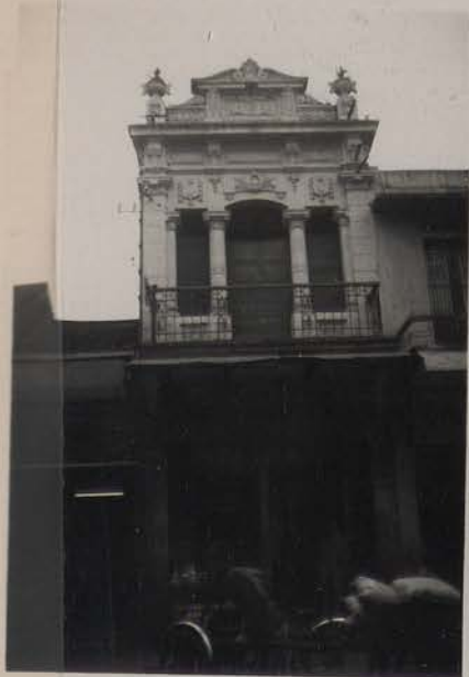
HANOI, 14 mars 1954.- 73, pho Hang thuoc Bac.