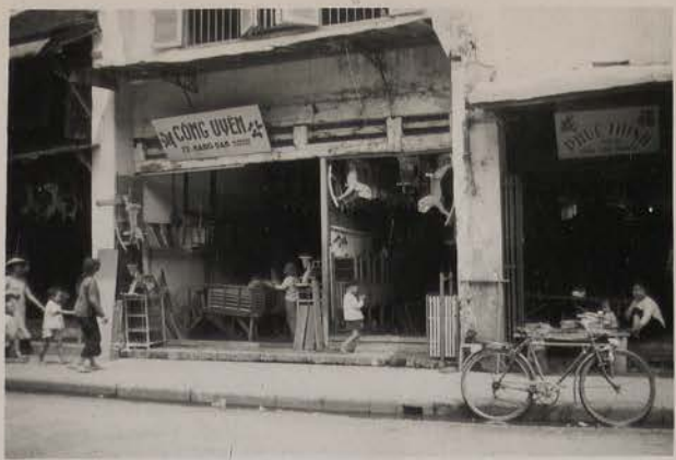
HANOI, août 1951.- Rue des Eventails, les marchands de jouets et d'instruments de musique.