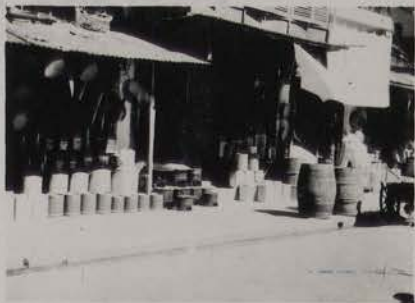
HANOI, juillet 1953.- Rue des Ferblantiers.