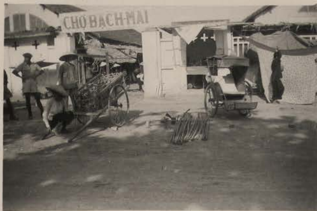
HANOI, 18 mai 1951.- Le marché Bach Mai.