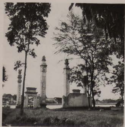
HANOI, août 1953.- Den Hai Ba.