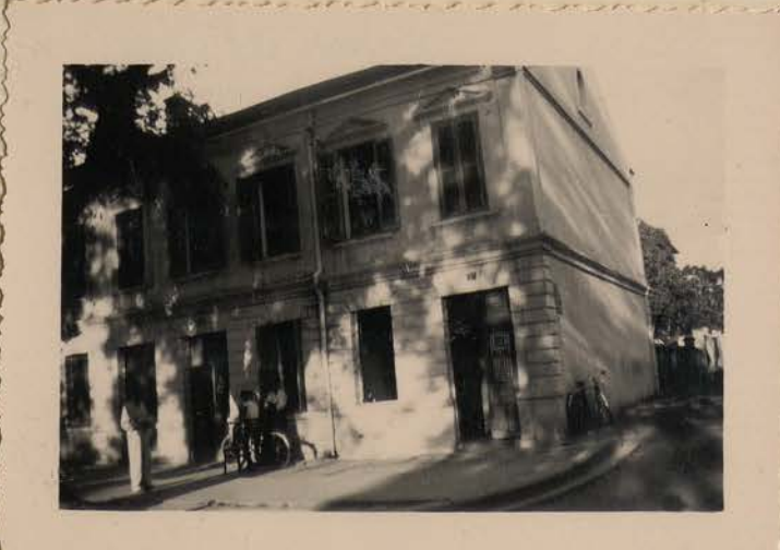
HANOI.- 51, Bd Rialan.