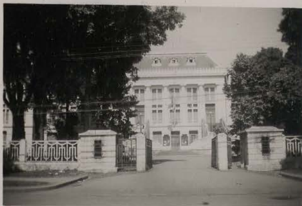
HANOI, février 1954.- Palais de Justice.