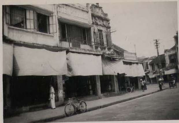
HANOI, 1951.- Marchands de malles et de cantines, rue des Caisses.