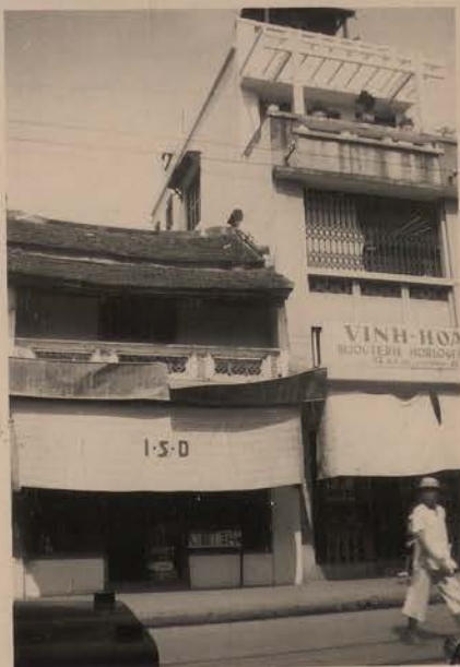
HANOI, juin 1952.- Maisons ancienne et moderne (Rue des Cantonais).