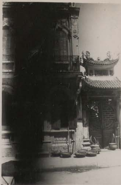
HANOI, août 1951.- Portail et maison (rue des Tubercules).