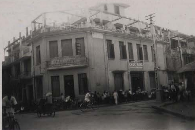
HANOI, juillet 1951.- Maison Chinoise, Entreprise Chuc King (teinturerie mécanique), angle rue J. Dupuis et rue Lepage.