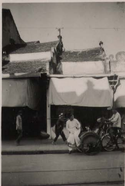
Hanoi, septembre 1951.- Magasins, rue de la Soie