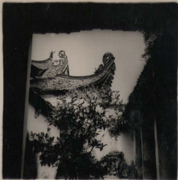
HANOI, août 1953.- Den Hai Ba (un intérieur de cour).