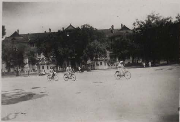
HANOI, août 1951.- Le Con Rep.