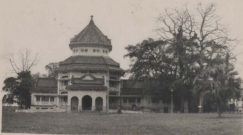
HANOI, 1952.- Le musée Louis Finot.