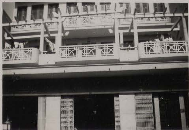
HANOI, mars 1954.- N° 17, 17A, 17B pho Luong Van Can.