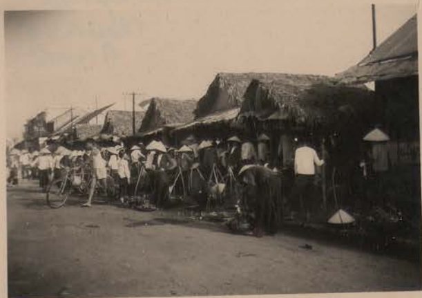
HANOI, juin 1952.- Le marché, Xa ngoc Ha.