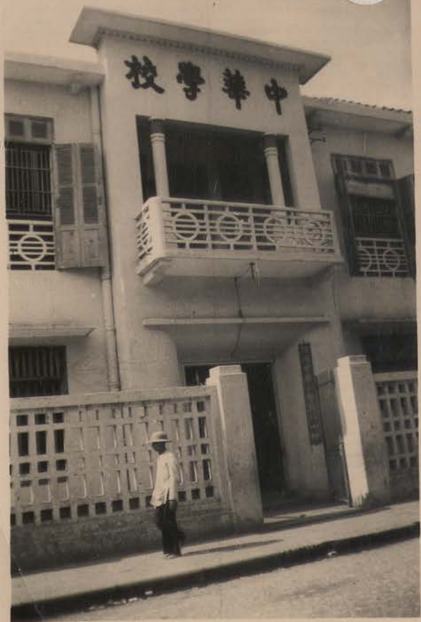
HANOI, avril 1952.- Le nouveau lycée chinois.