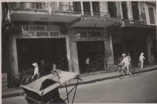
HANOI, juillet 1951.- Pharmacie, imprimerie et bazar, rue des Paniers.