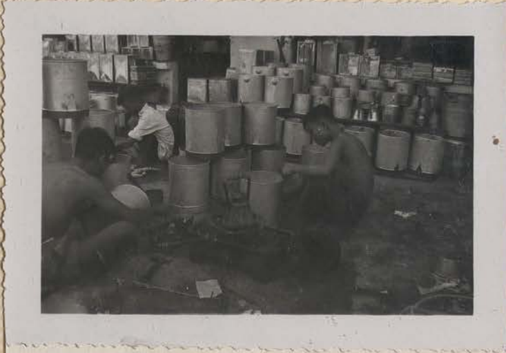
HANOI, juillet 1953.- Rue des Ferblantiers.