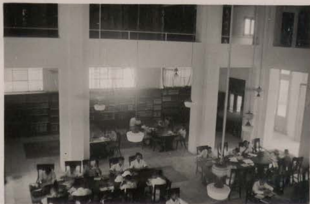
HANOI, septembre 1951.- La Bibliothèque P. Pasquier.