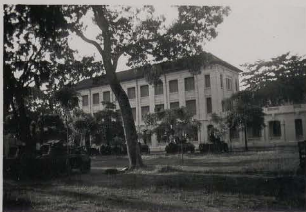
HANOI, août 1954.- La cour du L.A.S..