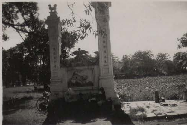
HANOI, août 1951.- Entrée de la Pagode du Grand Bouddha.