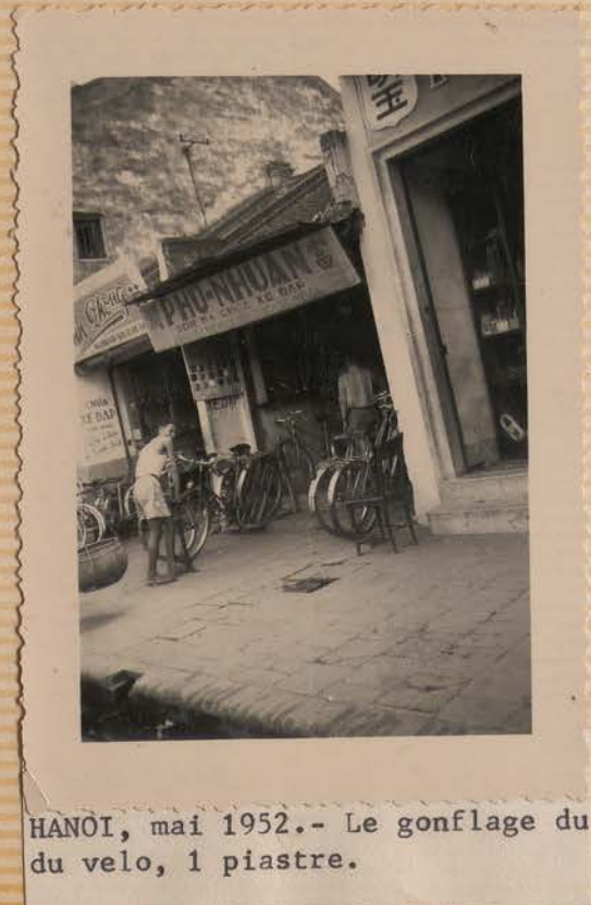
HANOI, mai 1952.- Le gonflage du velo, 1 piastre.