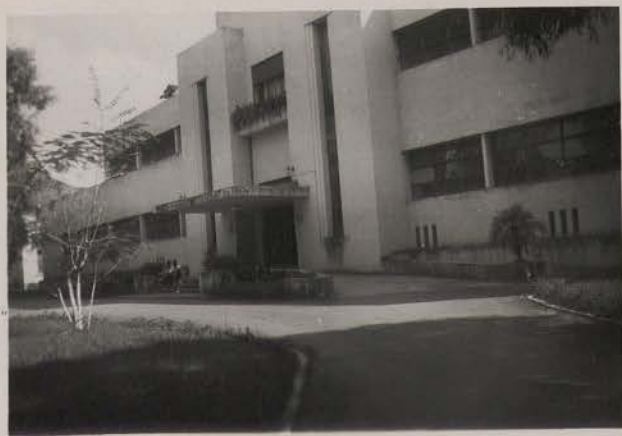
HANOI, novembre 1950.- Hôpital Lanessan, le pavillon des officiers.