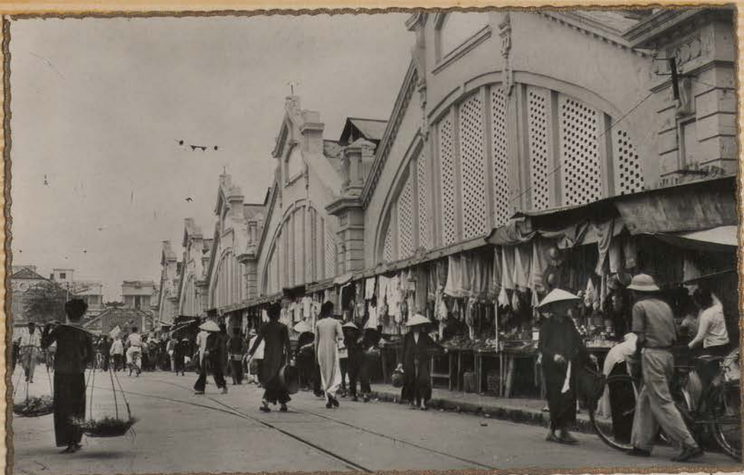
HANOI.- Le Grand Marché.