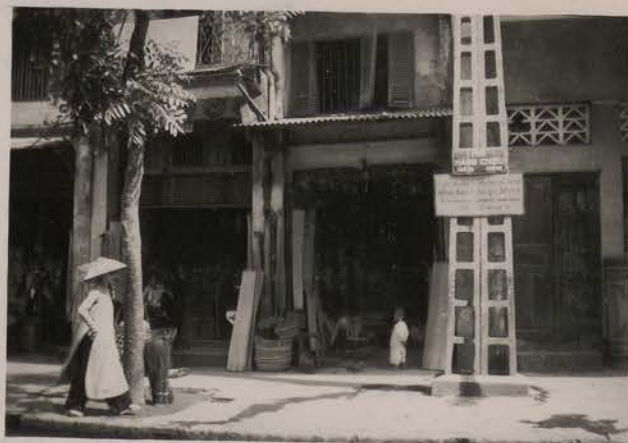
HANOI, mai 1951.- Marchand de nattes, rue des nattes.