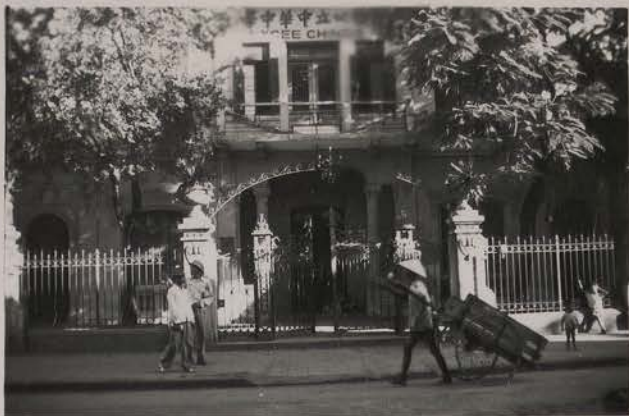
HANOI, juillet 1951.- Le lycée chinois.