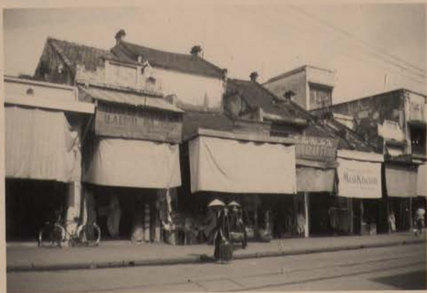
HANOI, juin 1952.- Maisons anciennes (rue de la Soie).