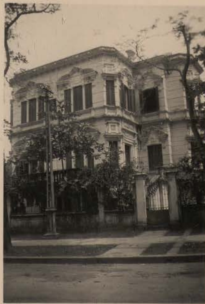
HANOI, avril 1952.- Maison de 1925; 58, Dai Lo Trang Hung Dao