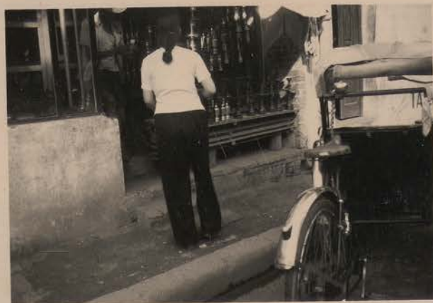
HANOI, mai 1951.- Marchand d'objets de culte bouddhique, rue Pho To Lich.