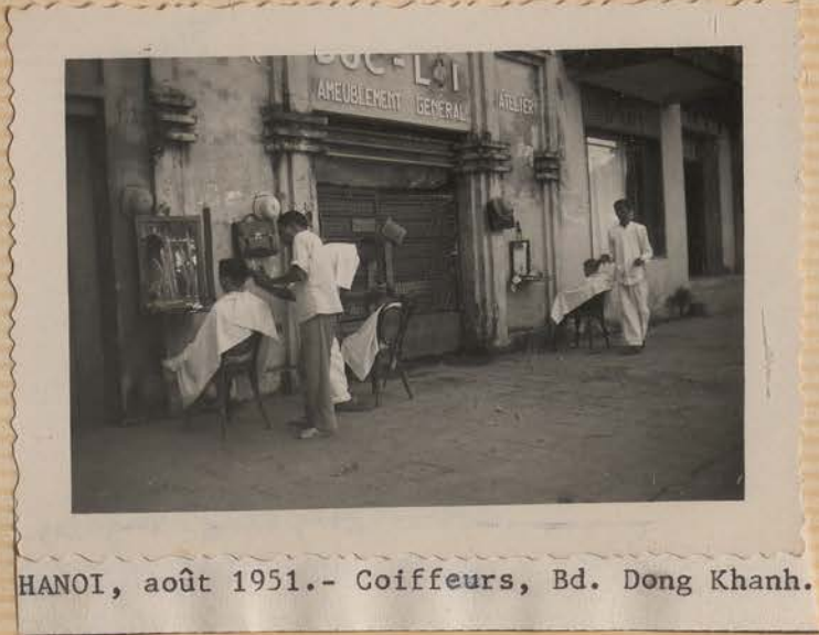
HANOI, août 1951.- Coiffeurs, Bd. Dong Khanh.