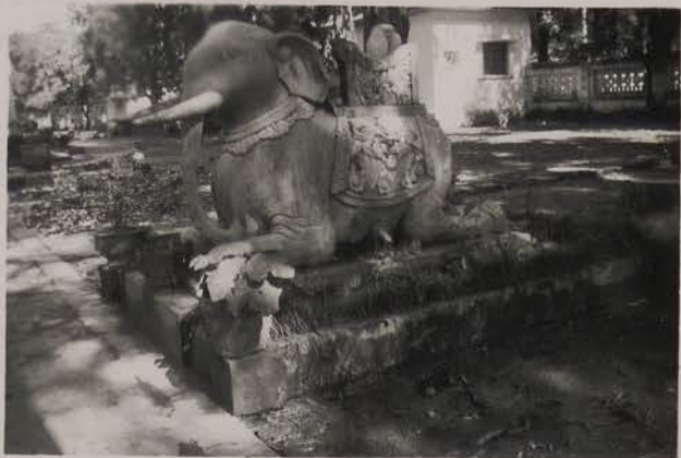
HANOI, août 1951.- Dans le jardin d'entrée de de la Pagode du Grand Bouddha.