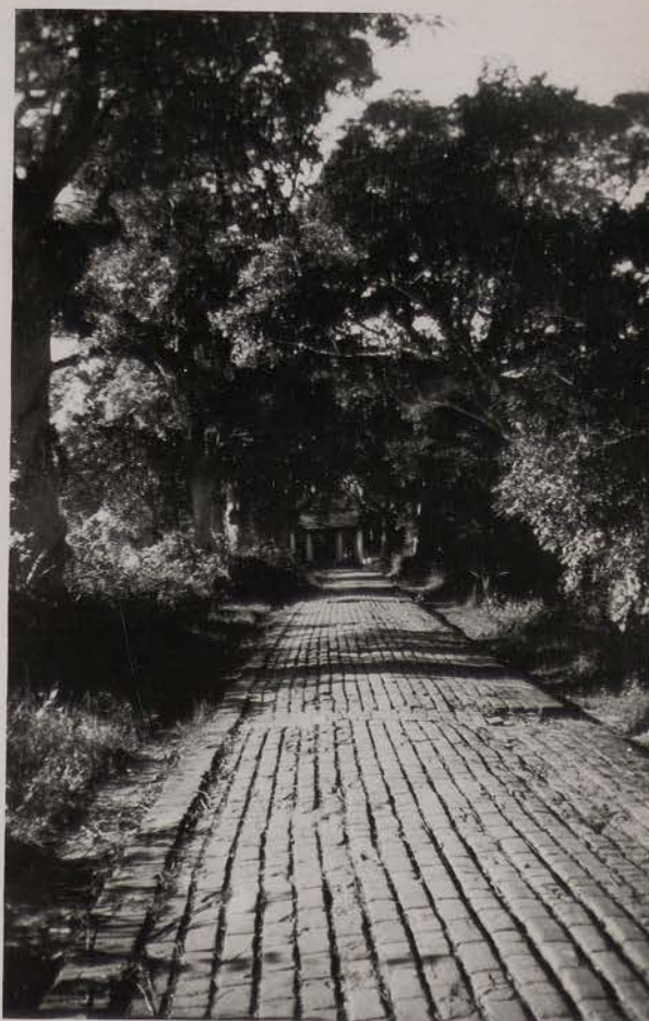
HANOI, 16 décembre 1951.- Pagode de Linh Lang, allée d'accès.