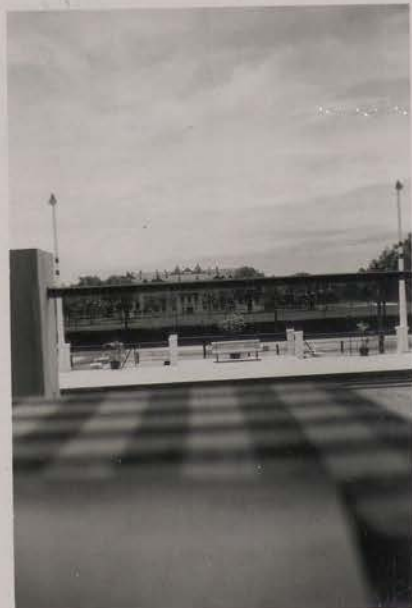
HANOI, 1 août 1951.- Le Cercle Sportif.