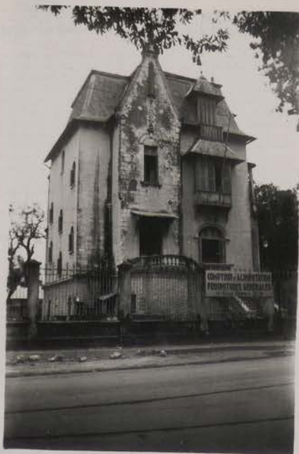
HANOI, août 1951.- Une maison "unique", av. Du Grand Bouddha.