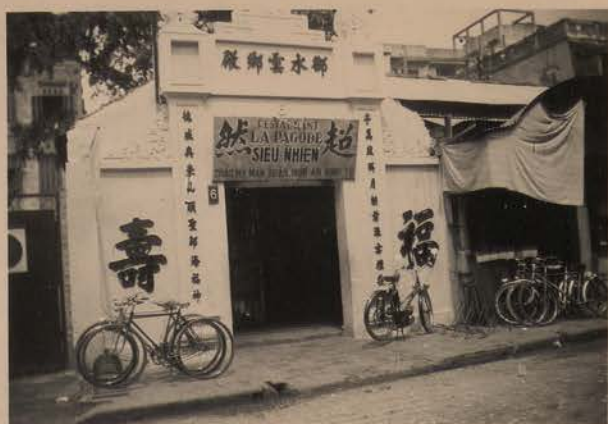
HANOI, juin 1952.- Restaurant Chinois, 6 pho Nguyen duy Han.