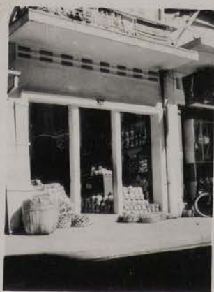
HANOI, juillet 1953.- Magasin moderne de bols, 74 rue des Tasses.