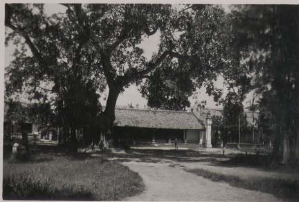
HANOI, juillet 1951.- Le Den Hai Ba.