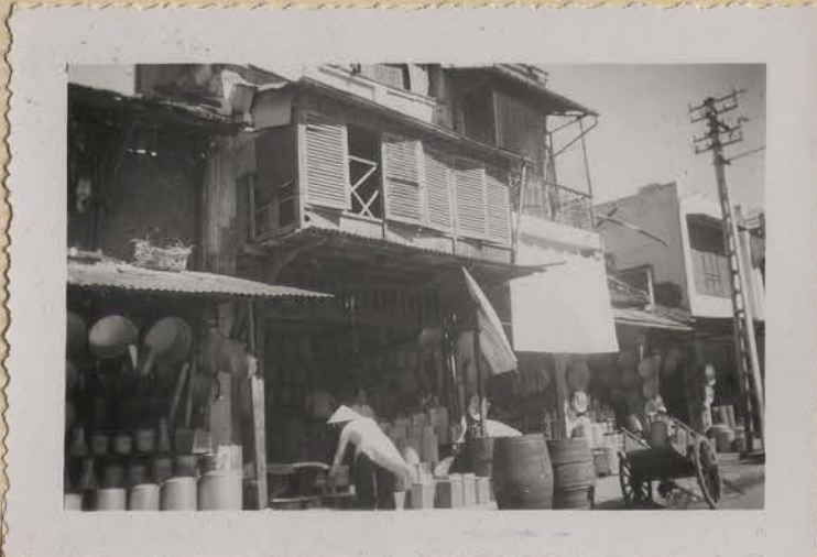
HANOI, juillet 1953.- Rue des Ferblantiers.