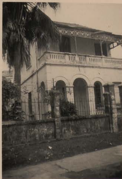
HANOI, avril 1952.- Maison des années 1900, 28, Dai Lo Quang Trung.