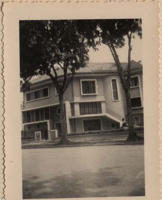
HANOI, avril 1952.- Maison moderne 46, Dai Lo Tran Hung Dao.