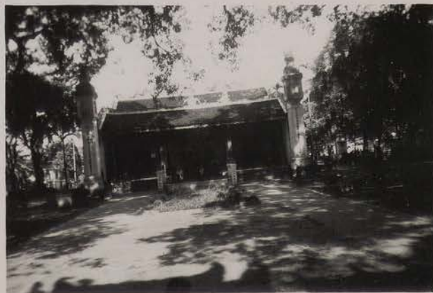
HANOI, août 1951.- Cour d'entrée de la Pagode du Grand Bouddha.