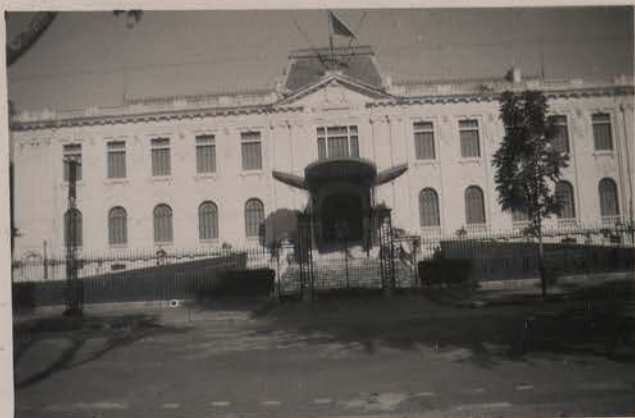
HANOI, août 1951.- L'Ancien Palais du Résident Supérieur au Tonkin.