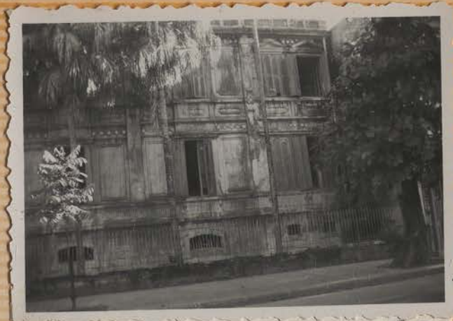
HANOI, juillet 1951.- Une maison, Rue Borguis-Besbordes.