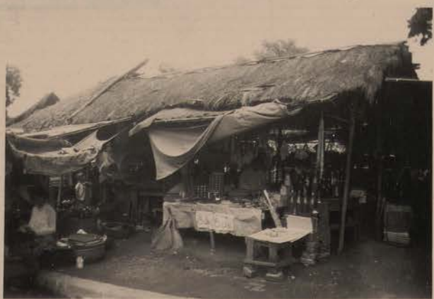
HANOI, juin 1952, le marché, pho Chau Long.