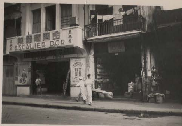
HANOI, juillet 1951.- Restaurant et magasins chinois, rue des Voiles.