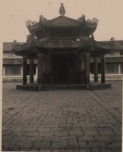
HANOI, 14 juin 1952.- Chua Chieu thien.