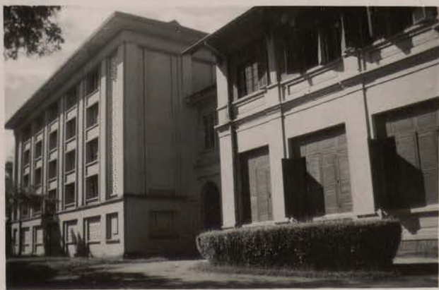
HANOI, août 1951.- L'EFEO.