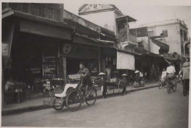
HANOI, juillet 1951.- Magasins de chaussures et claquettes, rue des Paniers.