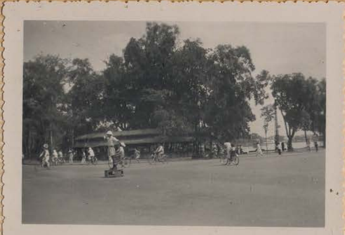
HANOI, 9 juin 1950.- Le marché aux fleurs.