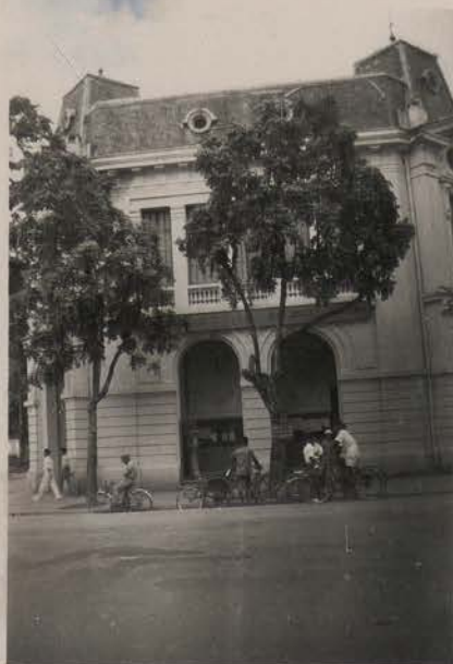
HANOI, août 1951.- Les P.T.T.