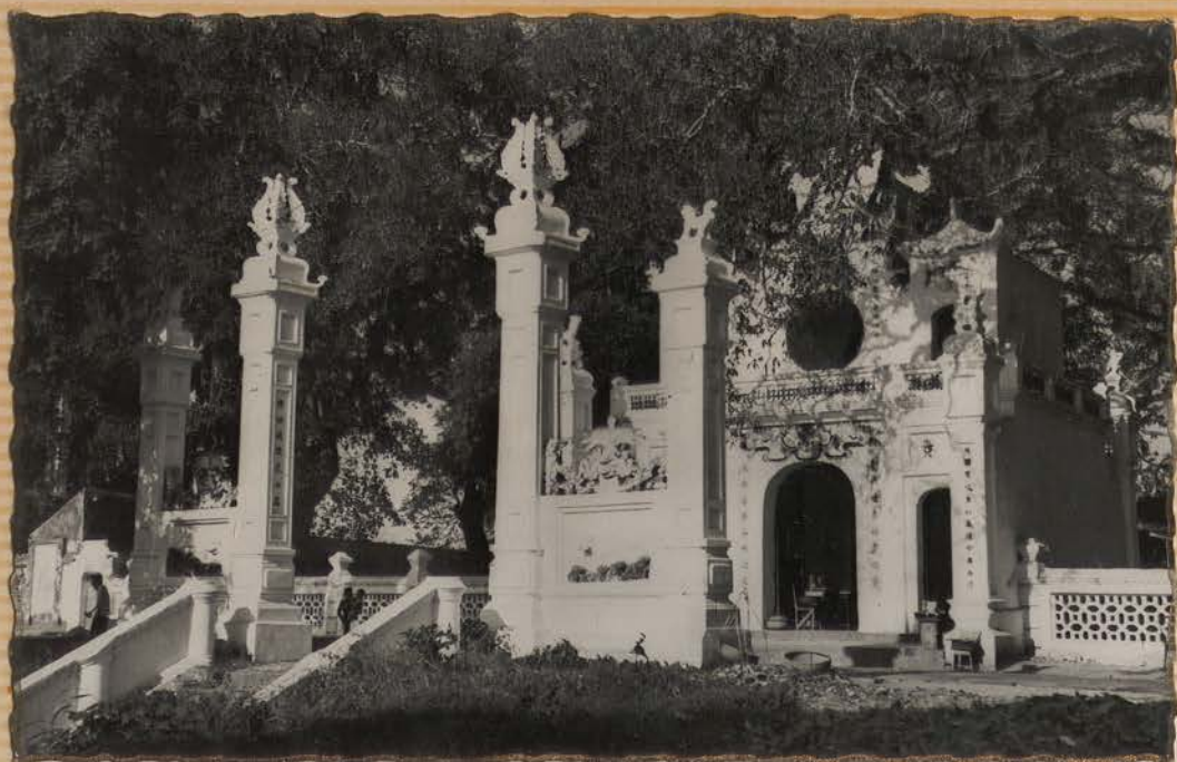
HANOI.- Pagode du Grand Bouddha.