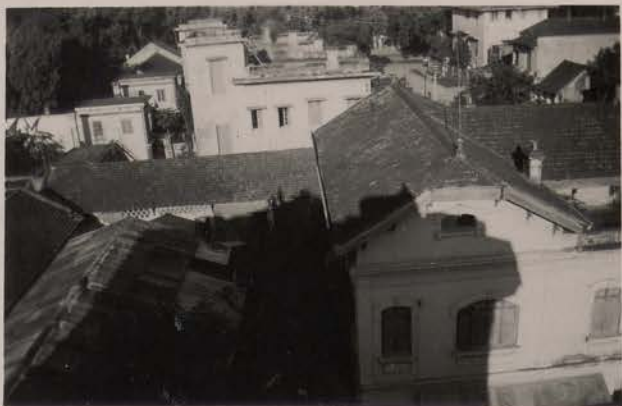
HANOI, juillet 1951.- Vue sur la cour intérieure du "Bazar Mondial".