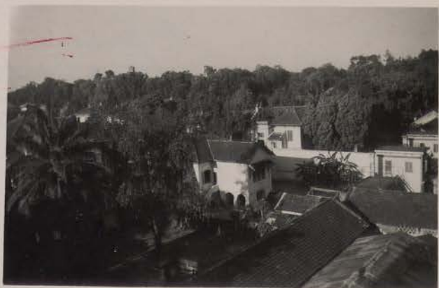
HANOI, juillet 1951.- Vues vers le mirador.