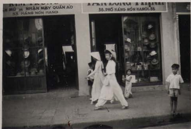
HANOI, aout 1951.- Les deux marchands de chapeaux de la rue des Chapeaux.