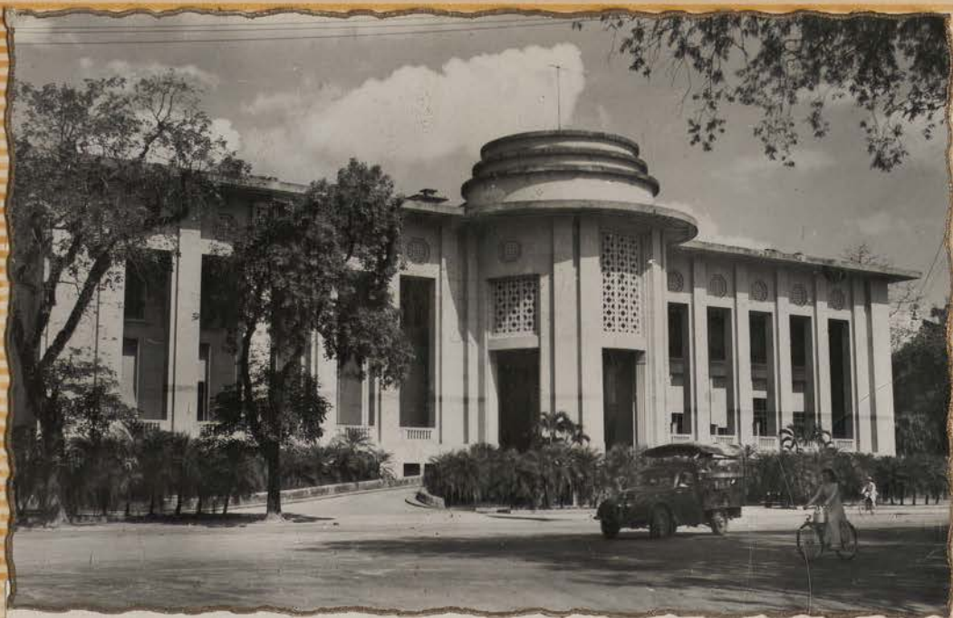
HANOI.- Banque de l'Indochine.