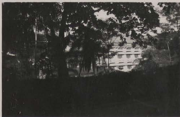
HANOI, juillet 1951.- Le musée Louis Finot.