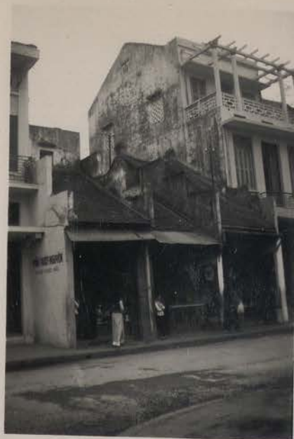
HANOI, 14 mars 1954.- N° 97, 99, 101, 103 de la rue pho Hang Thuoc Bac.