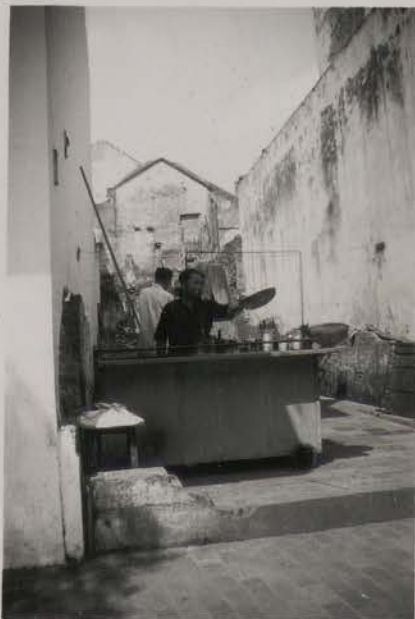
HANOI, mai 1954.- Lotissement urbain.