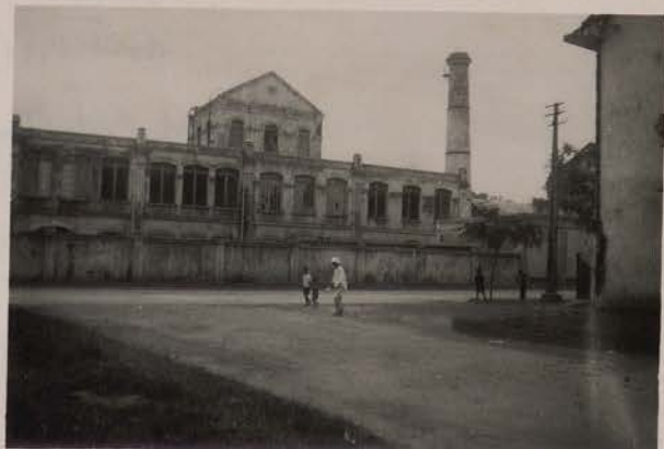
HANOI, août 1951.- La grande distillerie.