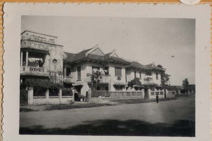
HANOI, août 1954.- Maisons du quartier Sud.