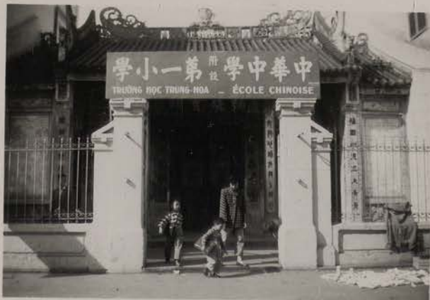
HANOI, mars 1954.- Ecole élémentaire des Fou Kien.