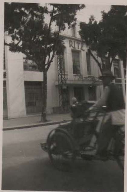
HANOI, 27 janvier 1952.- Le grand dancing.