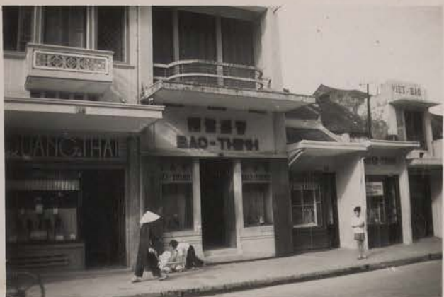
HANOI, juillet 1951.- Les bijoutiers, rue des Changeurs.