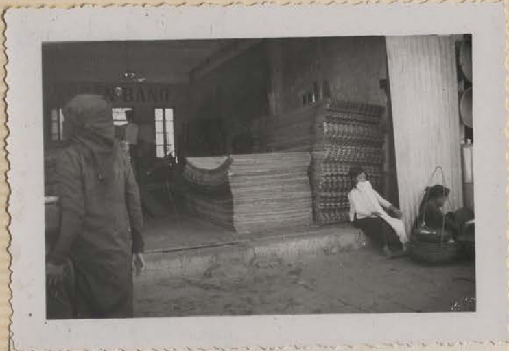
HANOI, juillet 1953.- Rue des Ferblantiers.