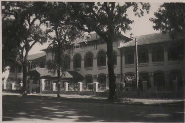
HANOI, août 1951.- L'école primaire Française (boulevard Rollandes).