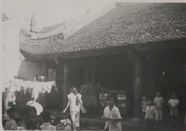
HANOI, 10 juillet 1954.- Dinh Hang Bac 50 rue des Changeurs.