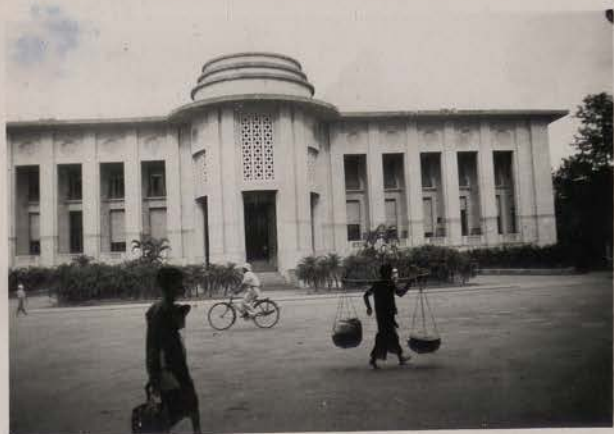
HANOI, 1951.- Banque de l'Indochine.