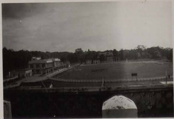
HANOI, juillet 1951.- Le Stade.