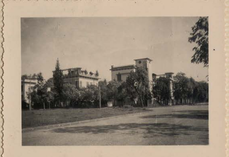
HANOI, avril 1952.- Les immeubles devant le Com Rep.