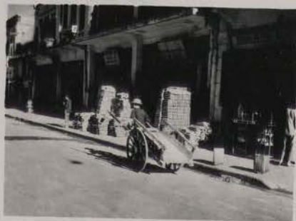
HANOI, juillet 1953.- Rue des Briques.