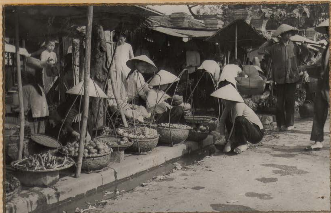
HANOI.- Marché.