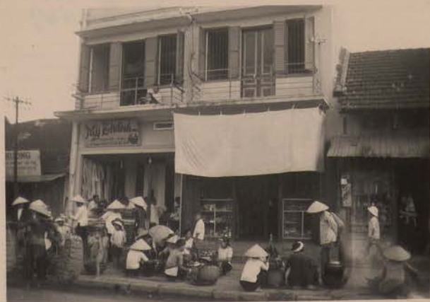
HANOI, juin 1952.- Le marché, Xa ngoc Ha.