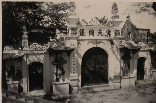
HANOI, avril 1952.- Den Duc Vua, digue de Yen Phu.