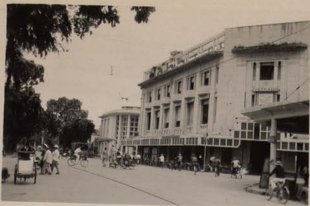
HANOI, mai 1951.- Le "Royal Taverne".