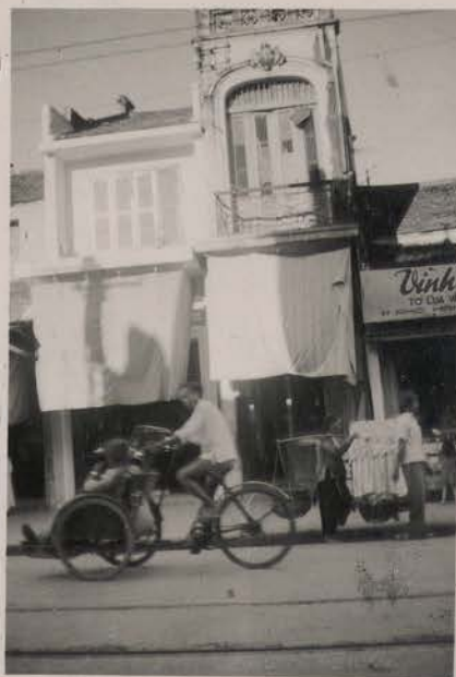
HANOI, septembre 1951.- Magasins, rue de la Soie.