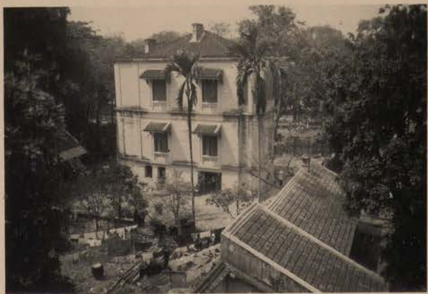
HANOI, avril 1952.- 51 bd Felix Faure.