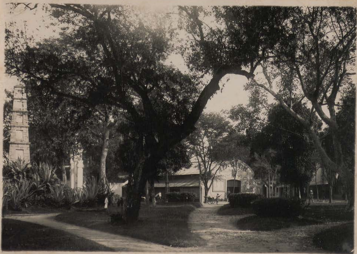
HANOI, idem.- (Service photographique E.F.E.O., n° 3887).