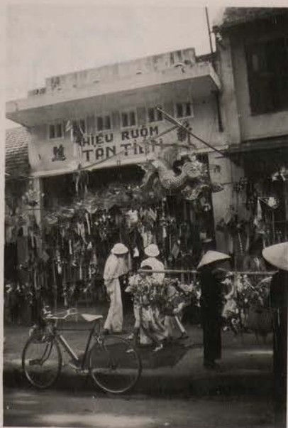
HANOI, 2 septembre 1951.- Marchand de lanternes pour la fête de la mi-automne.