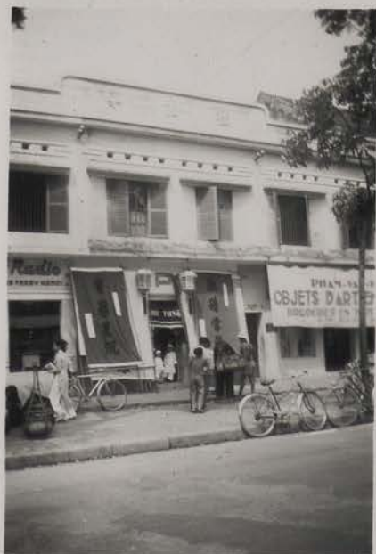
HANOI, mars 1954.