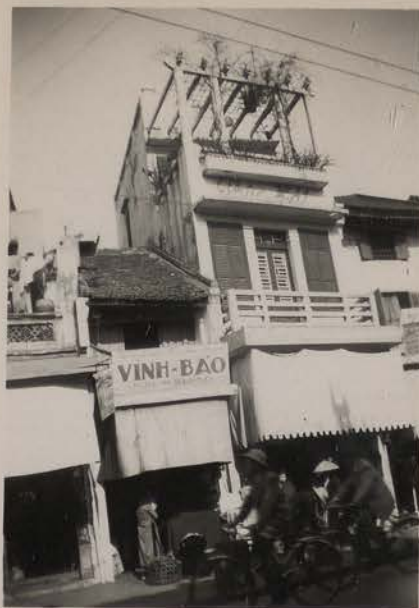
HANOI, mars 1954.- N° 5 et 7 de la rue pho Hang Dao.