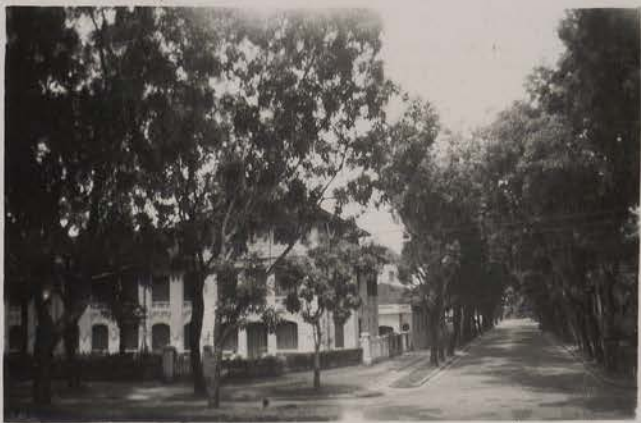
HANOI, août 1951.- Le Lycée Albert Sarrault.