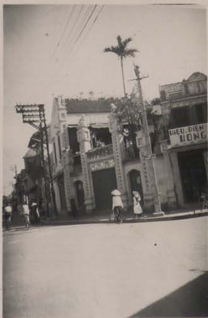
HANOI, août 1951.- Portail (angle des rues Hang Ca et Hang Cha Ca).