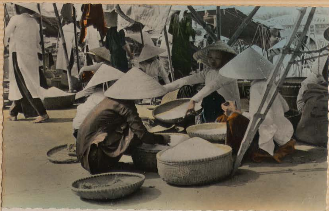
Marchandes de riz (carte postale Ho Duc Cao).