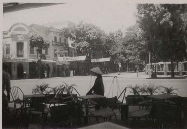
HANOI, août 1951.- Vue du "Royal Taverne"