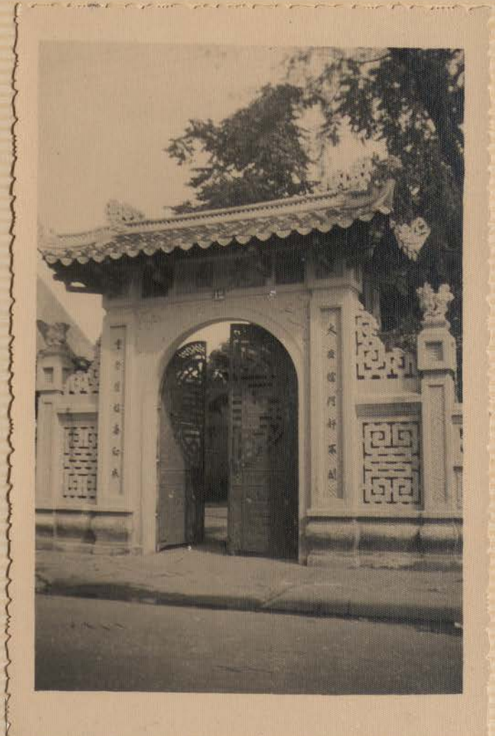
HANOI, août 1951.- N° 12, rue Bourret.