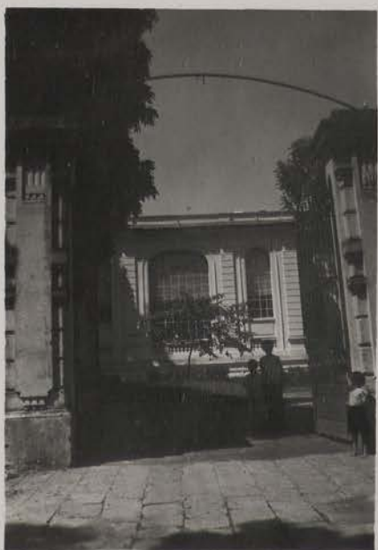
HANOI, 30 août 1954.- La Bibliothèque Générale.