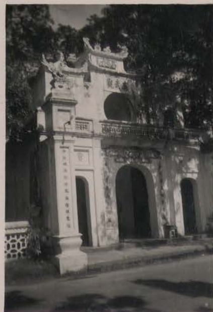
HANOI, août 1951.- Entrée de la Pagode du Grand Bouddha.