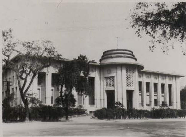
HANOI, 1952.- Banque de l'Indochine.