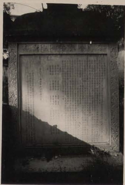
HANOI, août 1951.- Stèle de la pagode de Ham Long (détruite), Bd Doudart de Lagrée.