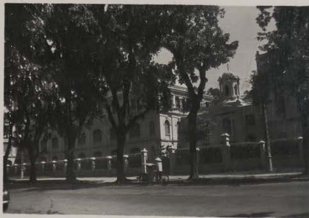
HANOI, 30 août 1954.-L'institution Sainte Marie (soeurs de St Paul de Chartres).