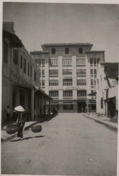
HANOI, 1951.- L'immeuble de l'IDEO