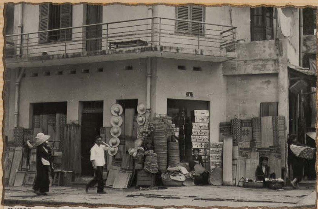
HANOI.- Boutiques de Nattes.