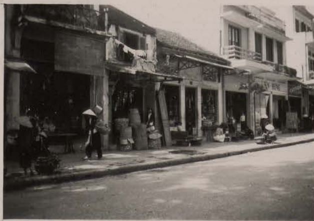
HANOI, mai 1951.- Marchand d'objets de culte bouddhique, rue Pho Hang Ma.