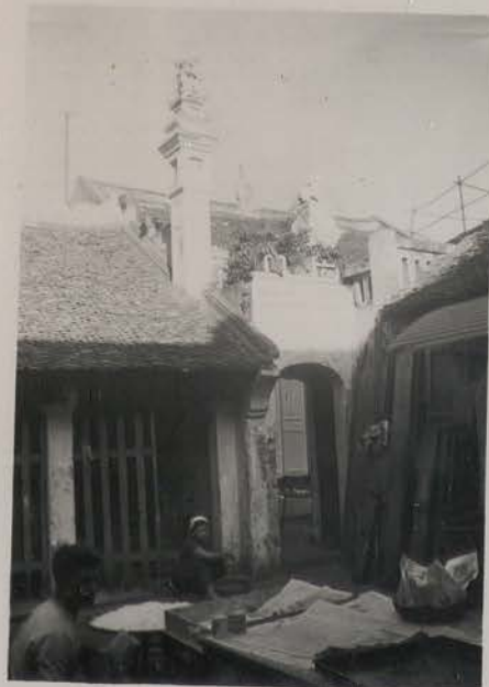
HANOI, 10 juillet 1954.- Dinh Duc Mon, 38 rue du Sucre