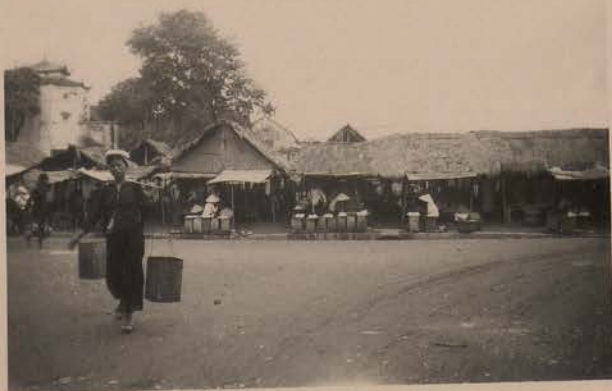
HANOI, juin 1952.- Le marché, pho Chau Long.