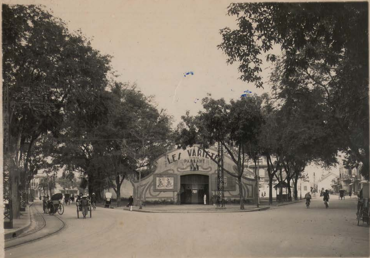
HANOI, 2 décembre 1933.- Façade du cinéma "Le Variétés", ex-cinéma Pathé , à l'angle du Boulevard Francis Garnier et de la Rue du Lac (Monitens).