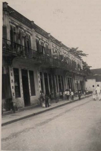
HANOI, août 1951.- Maisons chinoises, (pho Luong Ngoc Quyen).