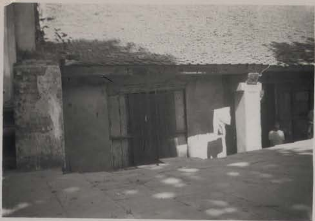
HANOI, 10 juillet 1954.- Dinh Cao tan, 166 Dai to Tran Quan Khai.