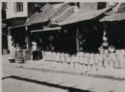
HANOI, juillet 1953.- Rue des Ferblantiers.