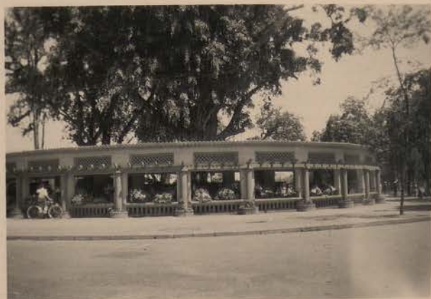
HANOI, avril 1949.- Le marché aux fleurs.