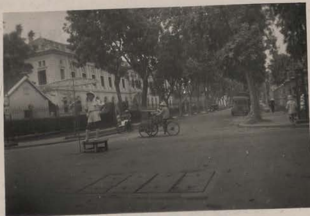
HANOI, 1951.- L'Institut du Radium : carrefour de la rue Borguis-Besbordes et de la rue RICHARD