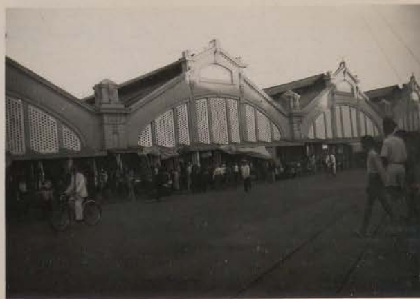
HANOI, novembre 1950.- Le Grand Marché.