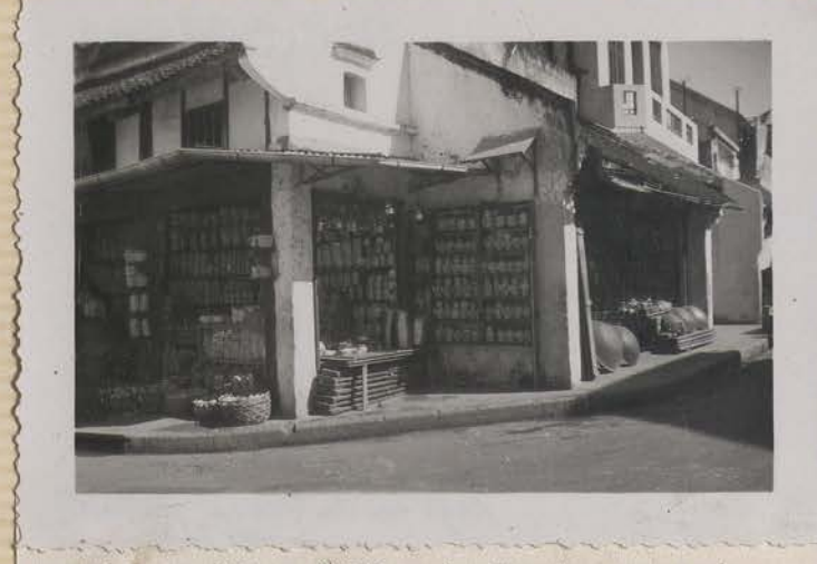
HANOI, juillet 1953.- Angle des rues des Tasses et Vieille des Tasses.