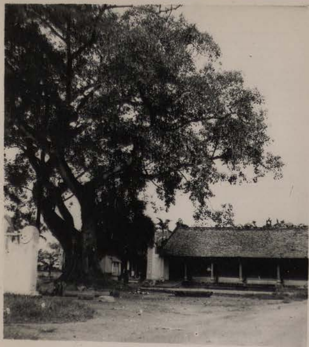
HANOI, août 1953.- A côté du Den Hai Ba.