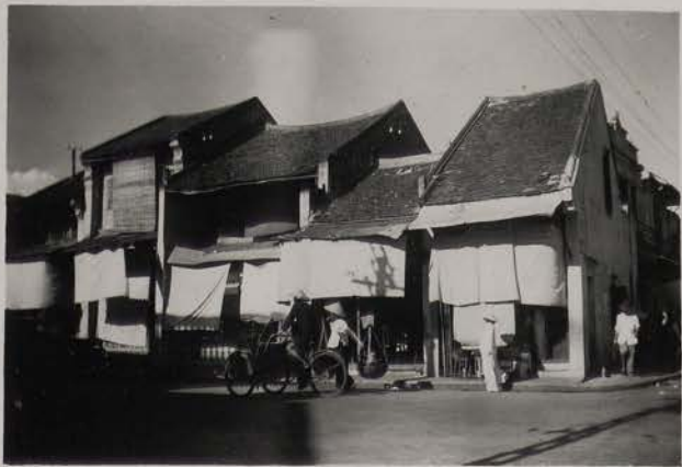
HANOI, août 1954.- Maisons anciennes.