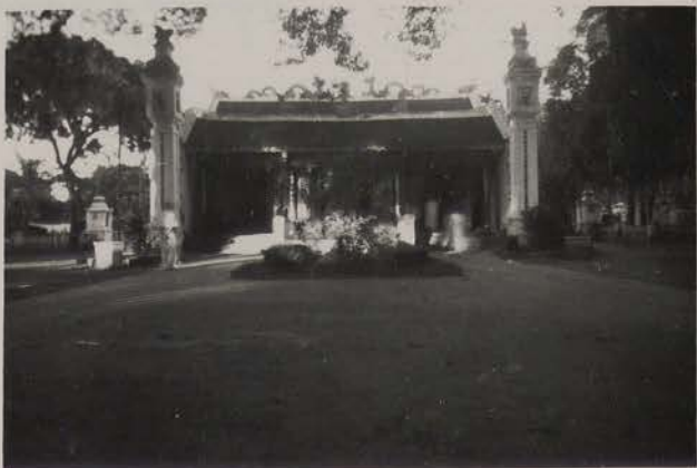
HANOI, juillet 1953.- Pagode du Grand Bouddha.