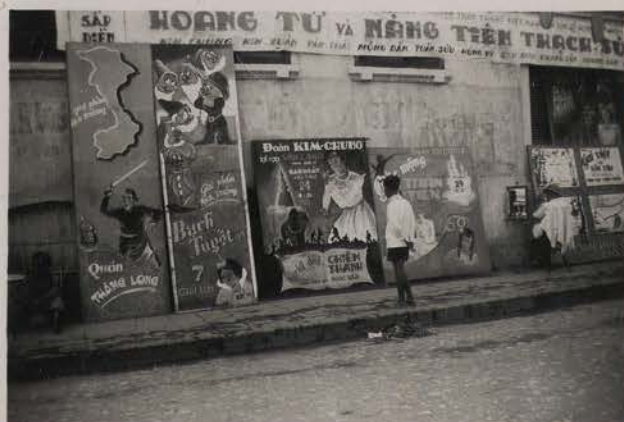
HANOI, juillet 1951.- Le cinema de la rue Géraud.