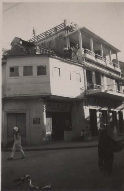
HANOI, juillet 1951.- Maison chinoise (rue des Voiles).