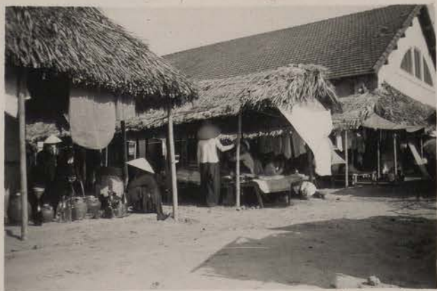
HANOI, 13 mai 1951.- Le marché de Bach Mai.