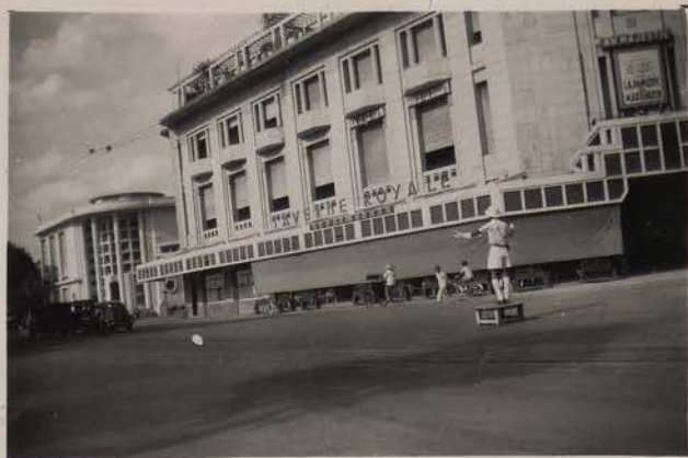
HANOI, 1952.- Le "Royal Taverne" et la Chambre de Commerce.