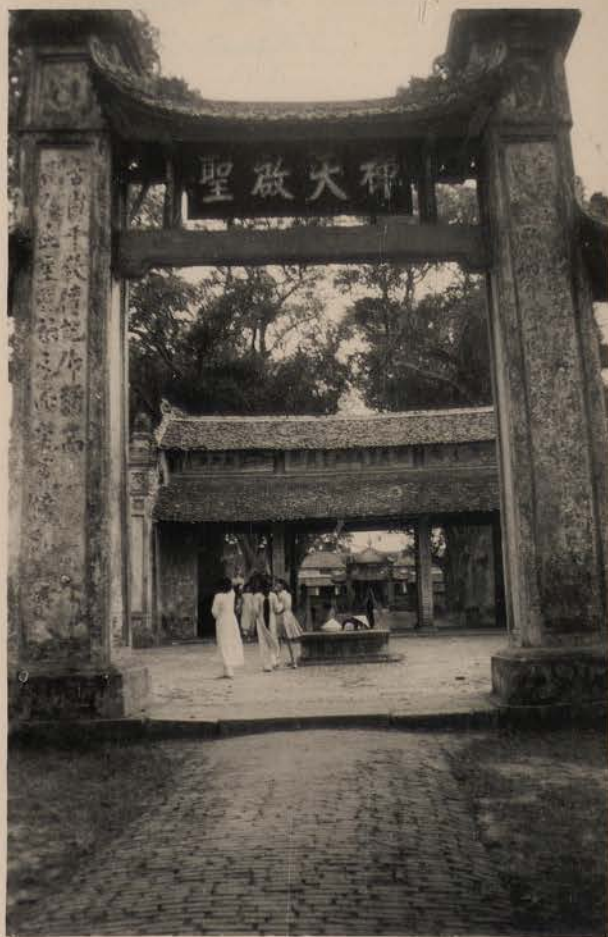
HANOI, juin 1952.- Chua Chieu thien (Pagode des dames).