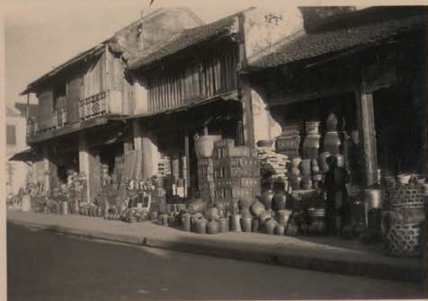
HANOI, juin 1952.- Marchands de poterie et de cercueil, rue de la Saumure.