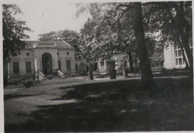
HANOI, aout 1951.- Bibliothèque P. Pasquier.