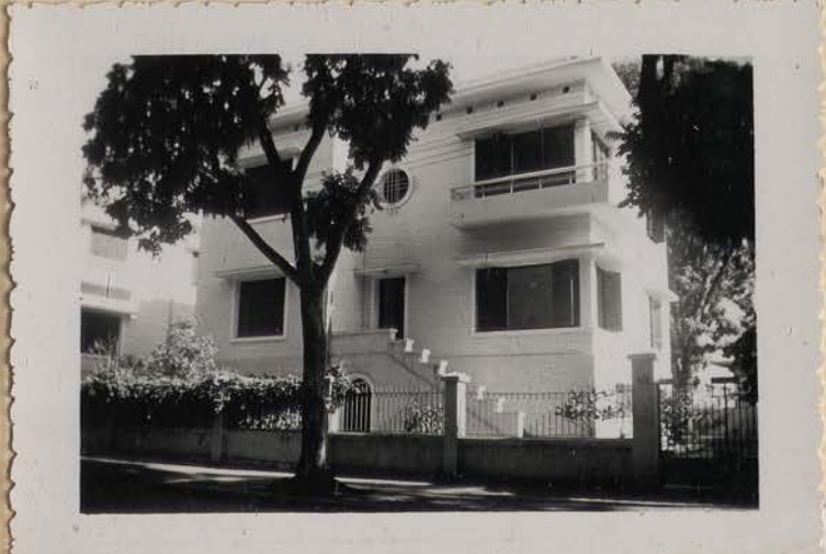
HANOI, août 1954.- Maisons modernes.