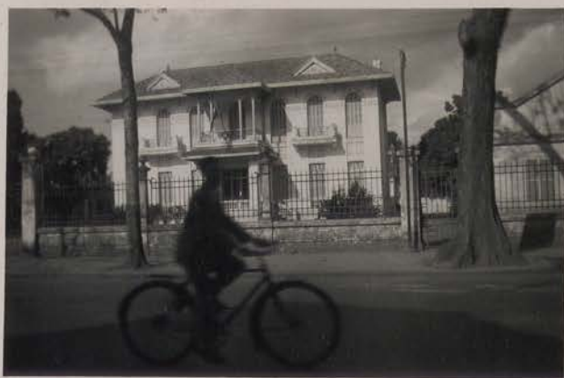
HANOI, janvier 1952.- Le Consulat Général de Chine, rue Borguis-Desbordes.