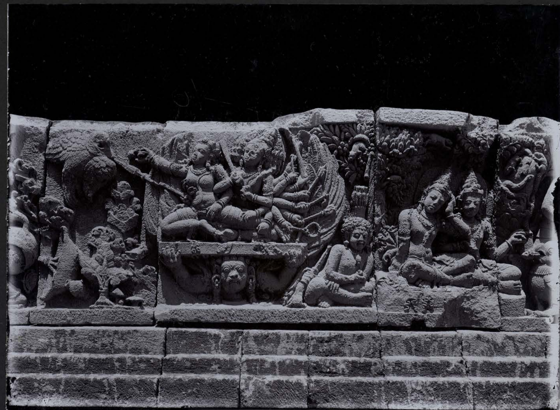
Série du Ramāyana — Combat de Daçamukha et de Jatayus