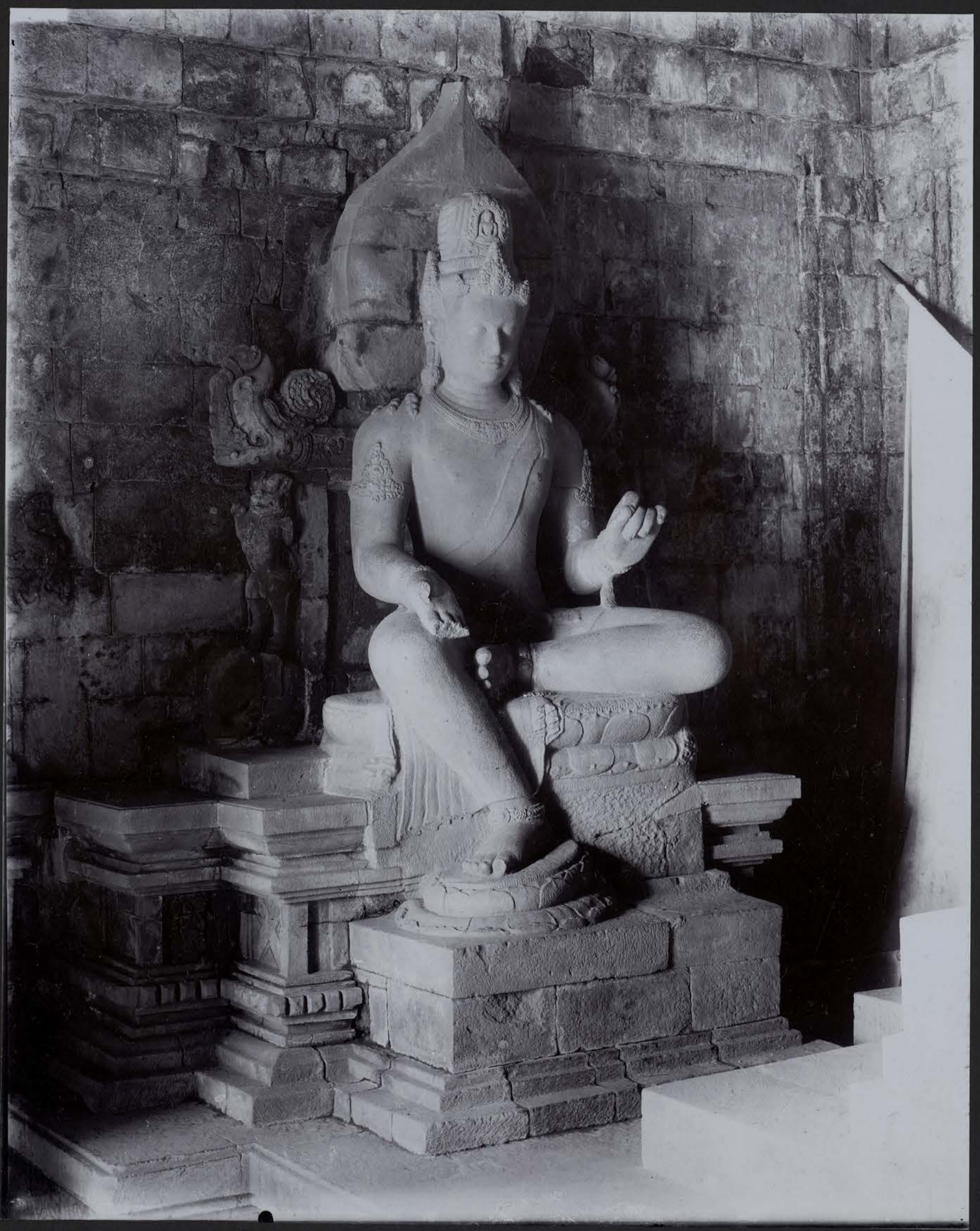
Le Bodhisattva Avalokitesvara