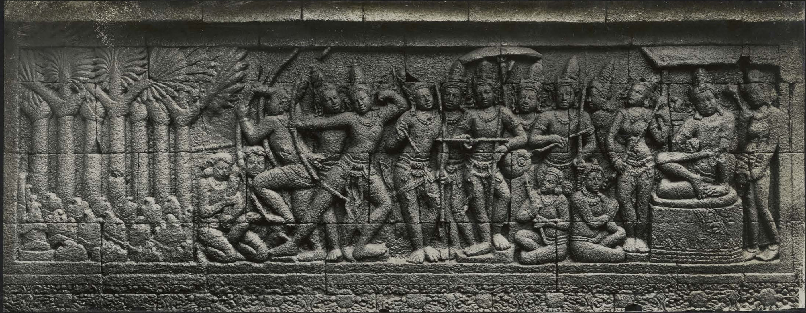
Le Bodhisattva prouvant ses Capacités guerrières