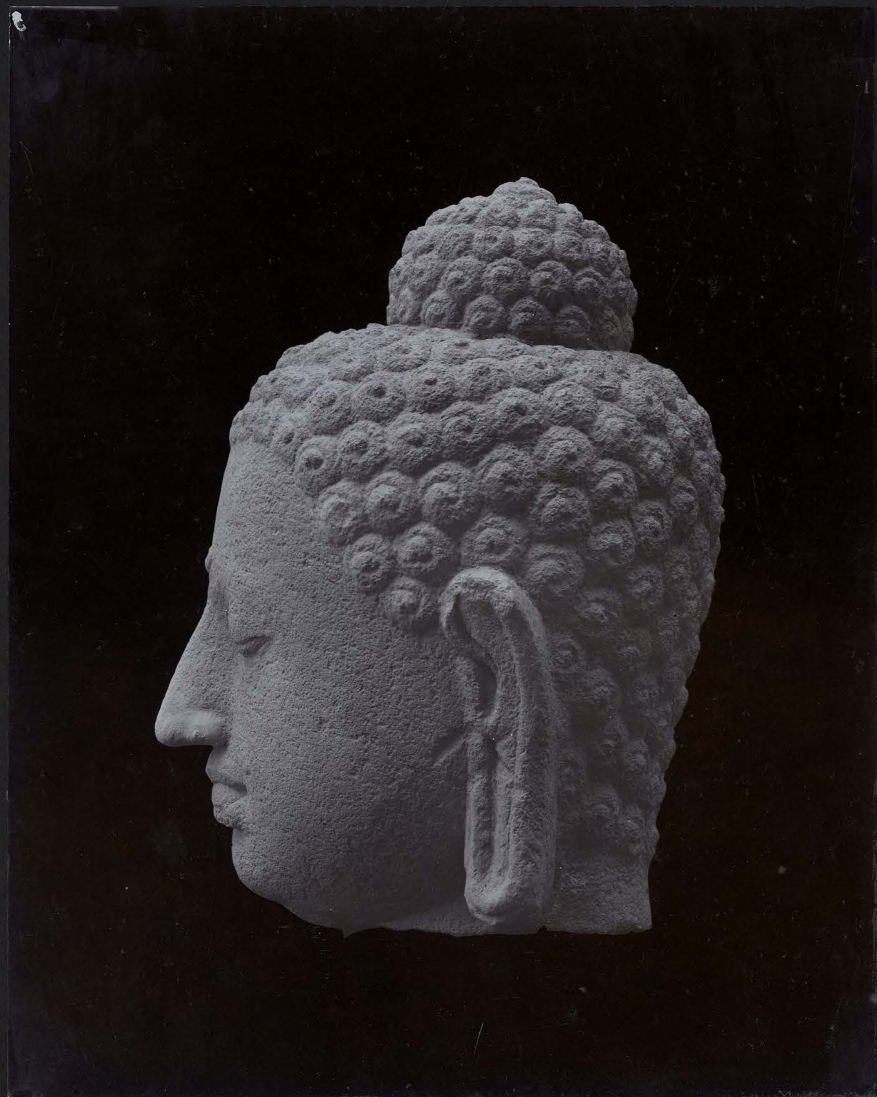
Tête de Bouddha