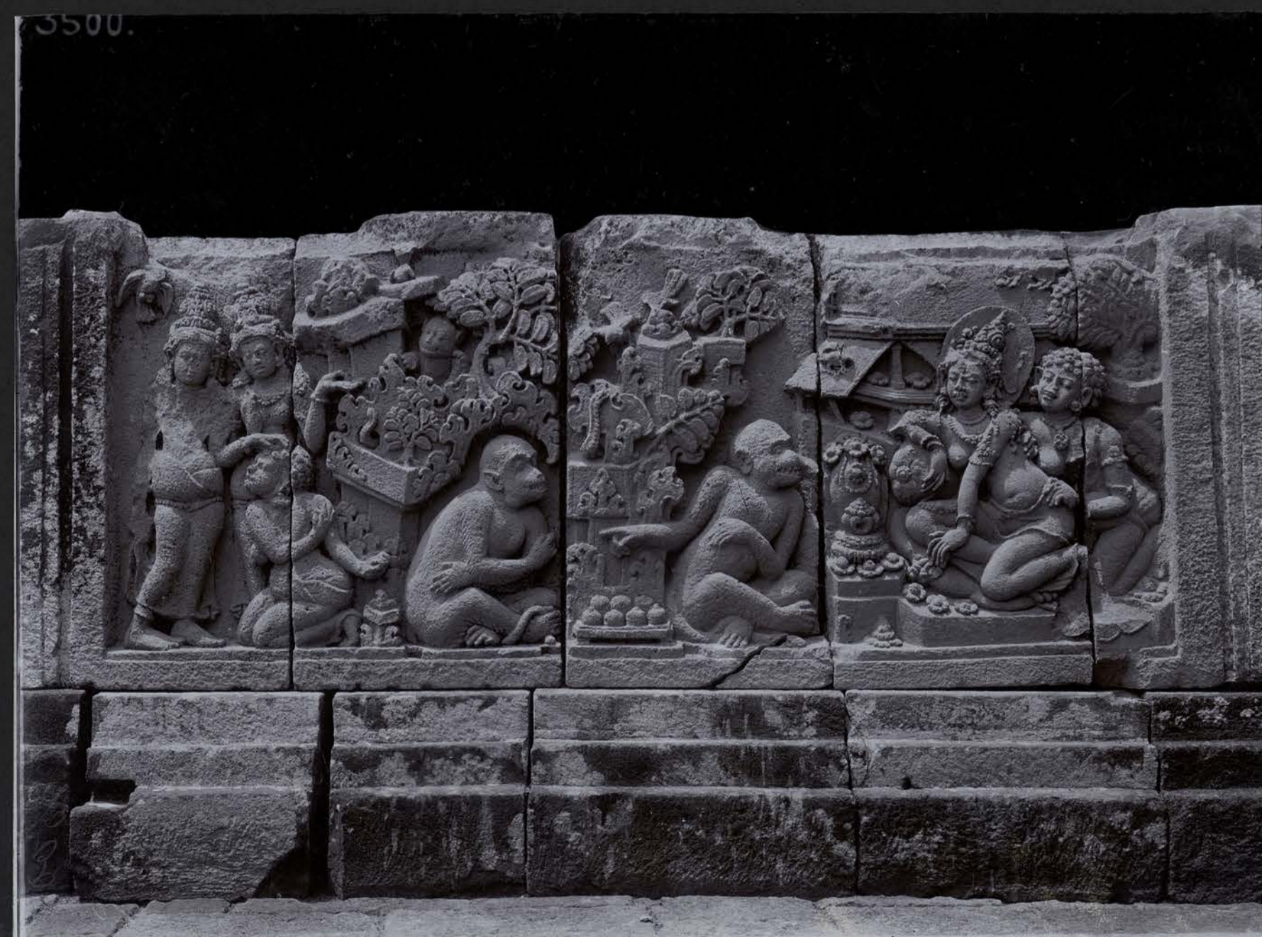
Série du Ramāyana — Hanumat d'écouvrant Sītā à Langka