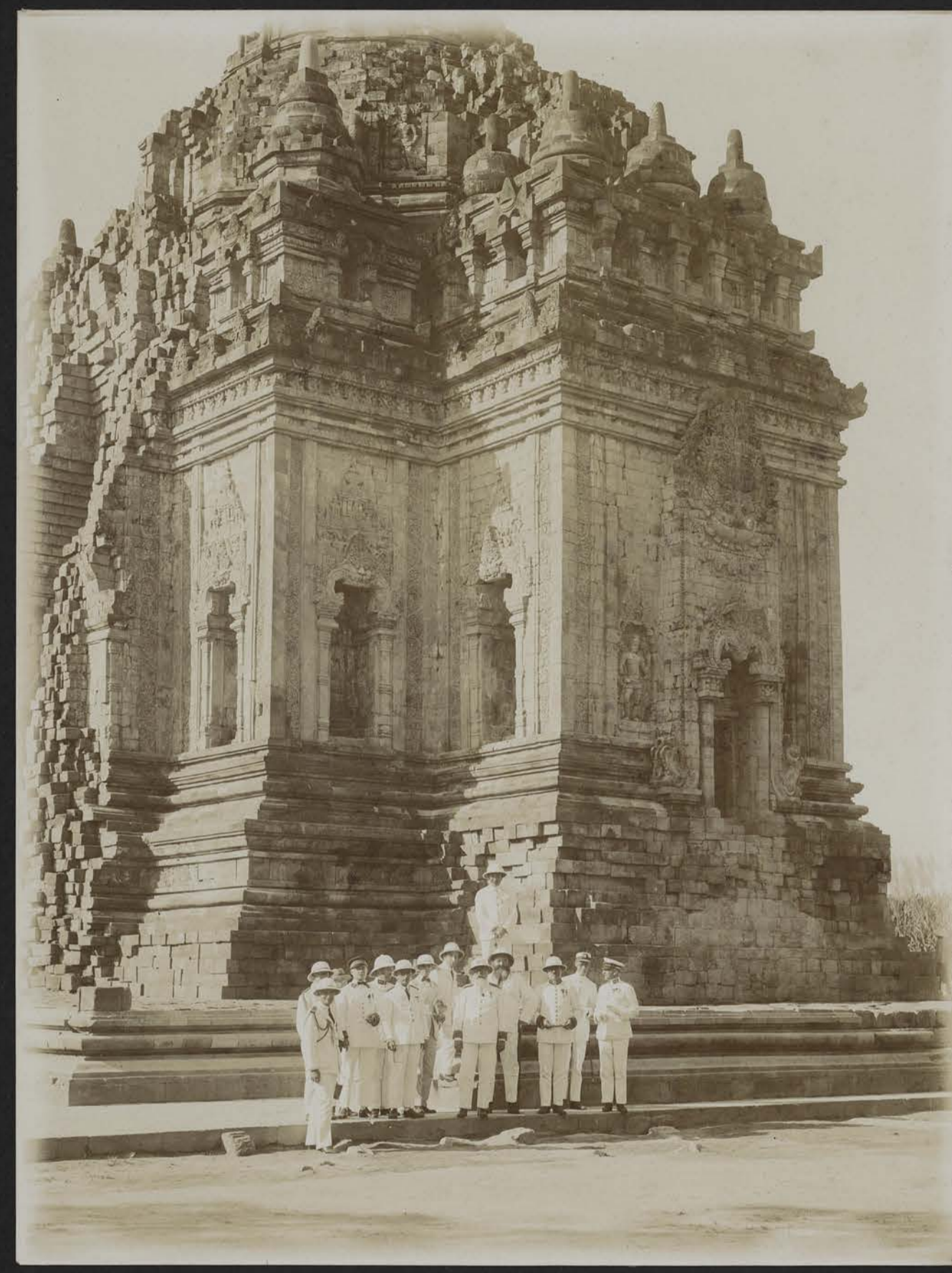
Visite de Son Excellence