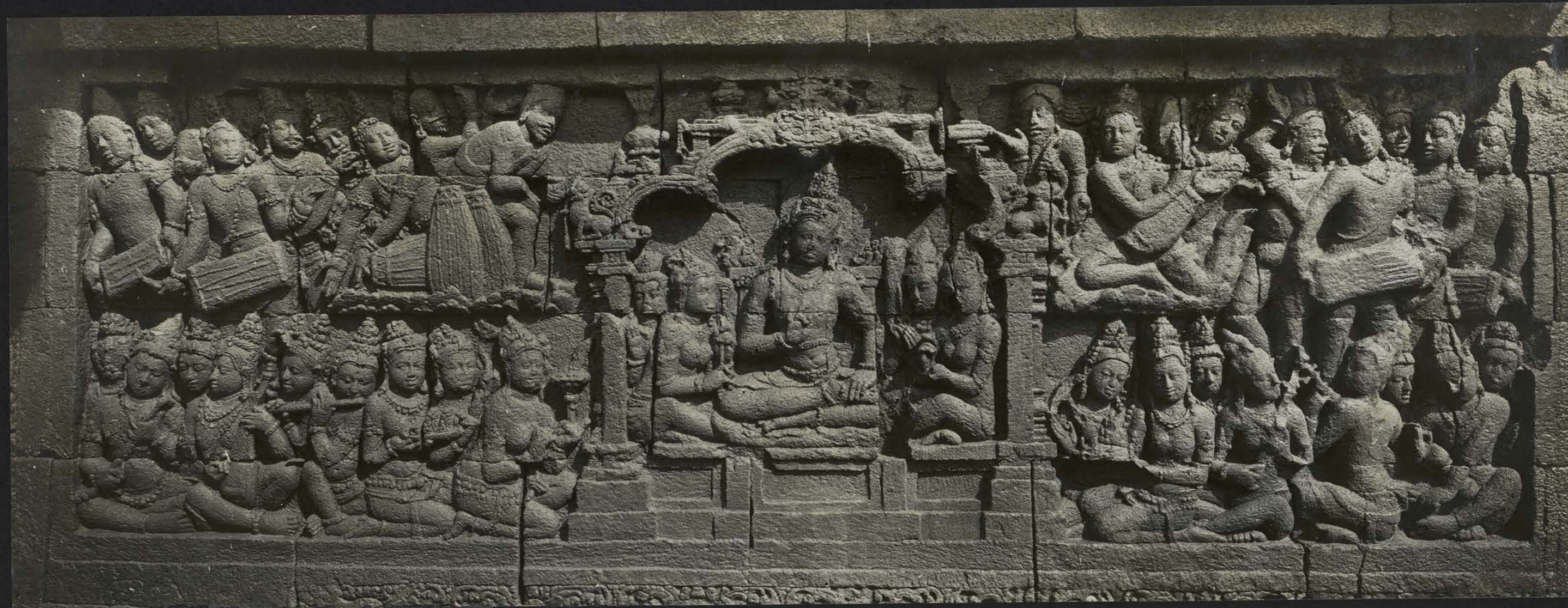
Le Bodhisattva dans le ciel Tushita