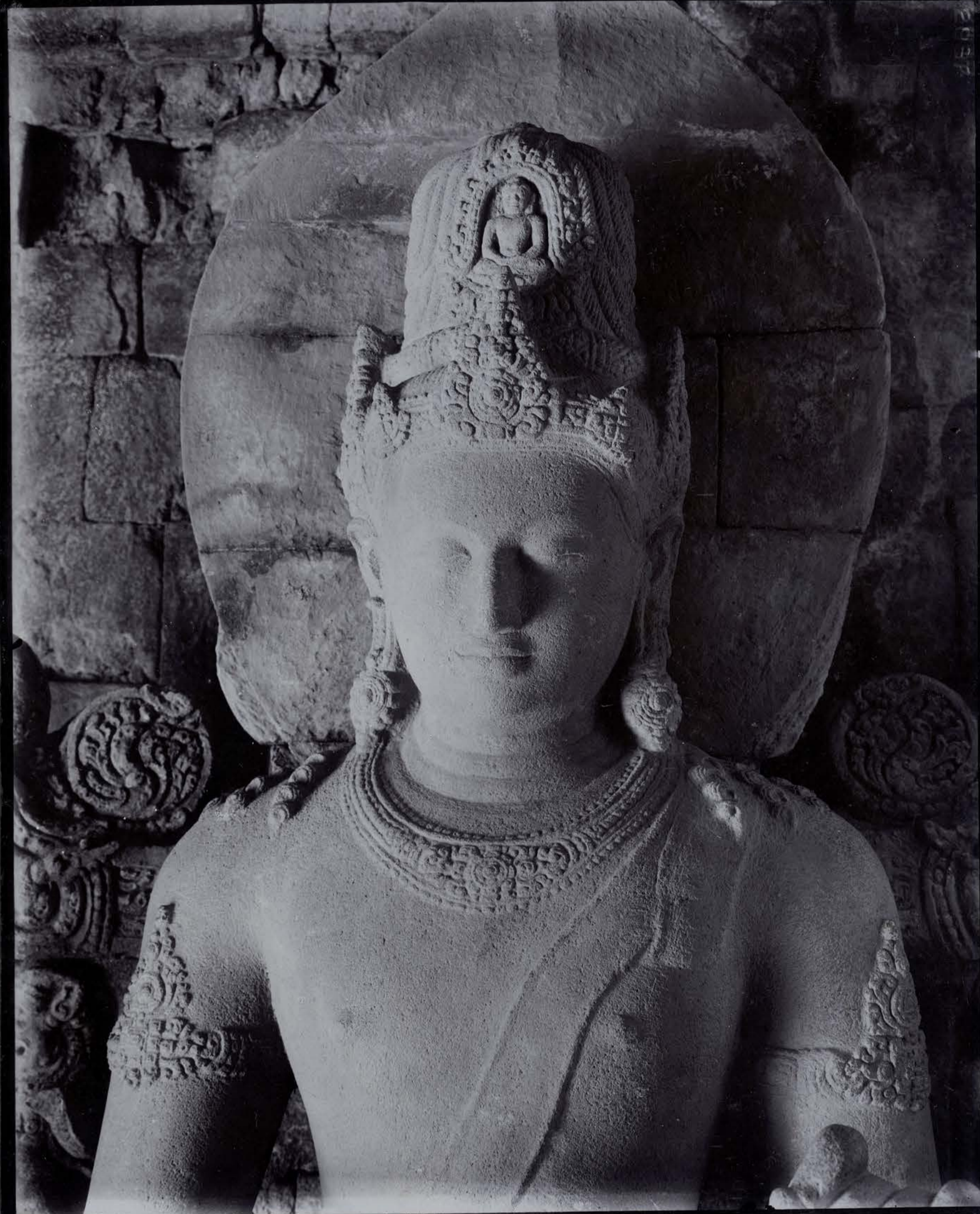
Tête du Bodhisattva Avalokiteçvara