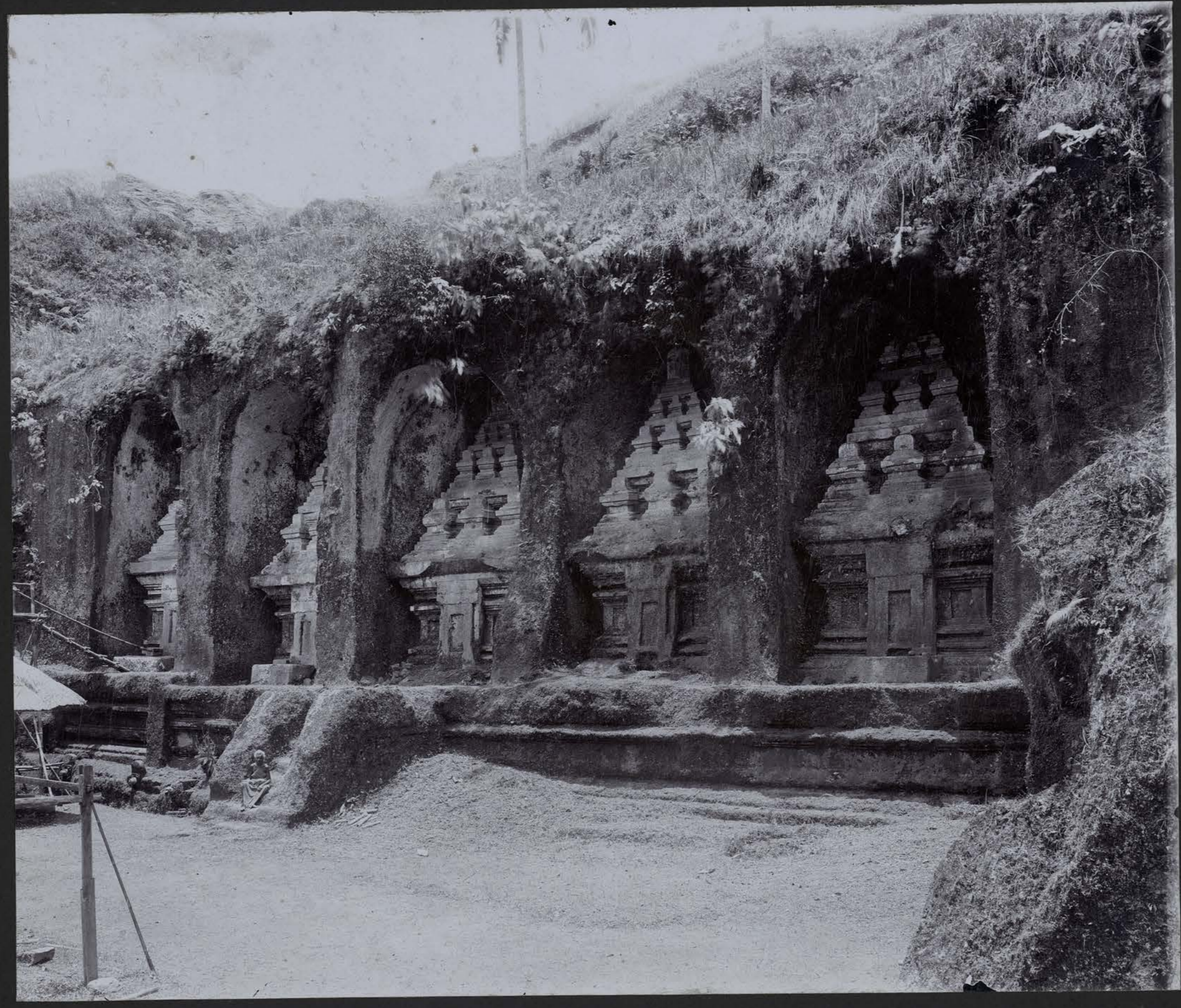
Monastère du Goenoeng Kawi — Les Tombeaux Principaux