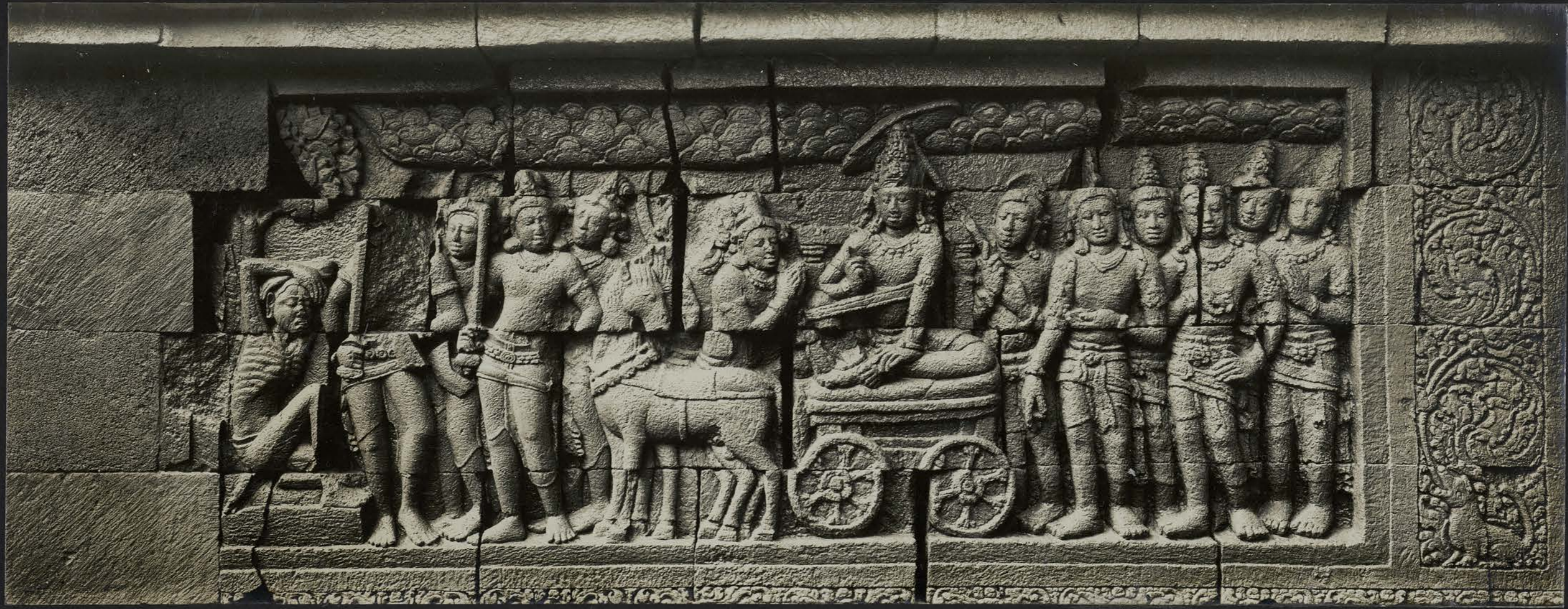
Le Bodhisattva rencontrant le malade