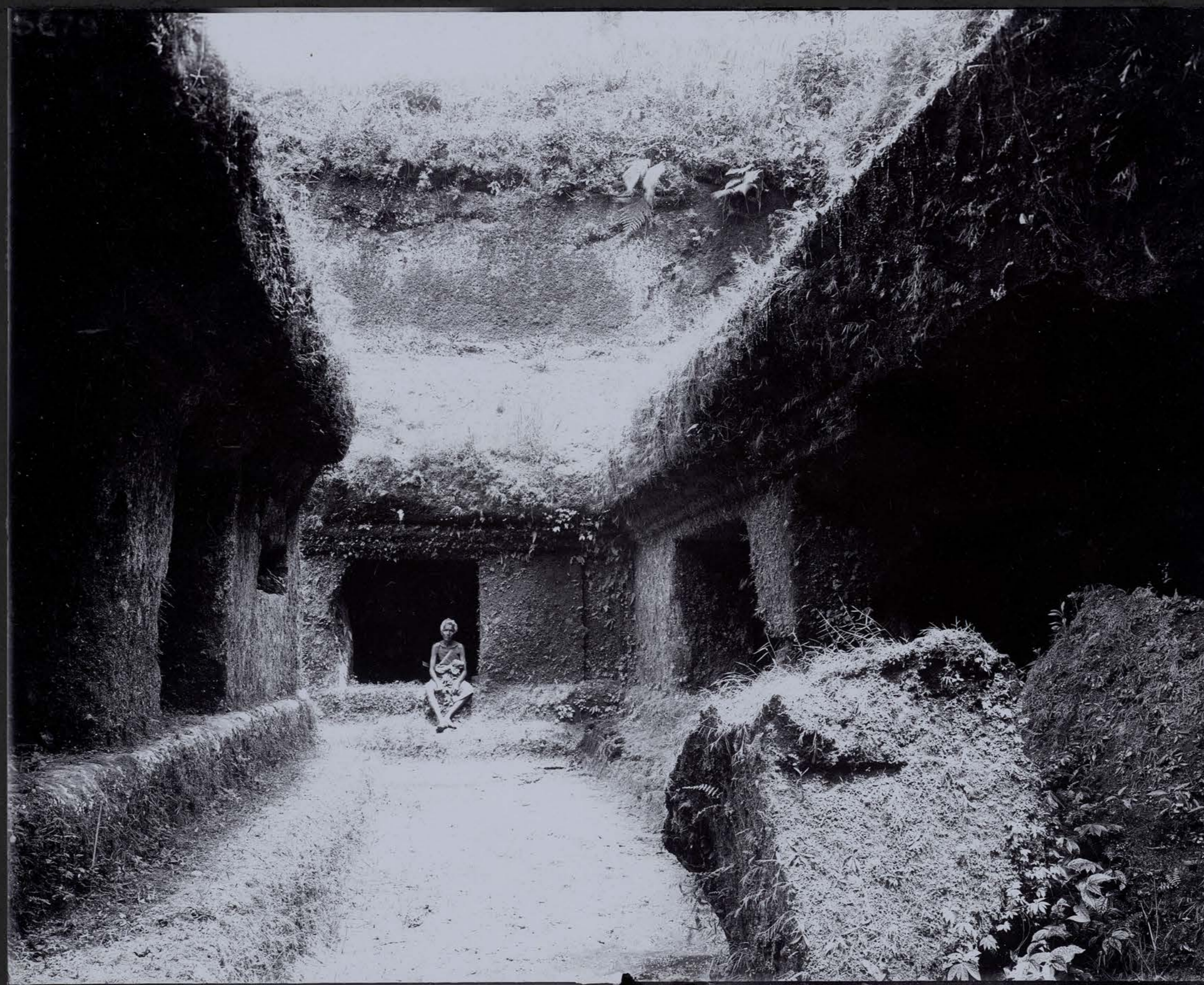
Monastère du Goenoeng Kawi — La Place Centrale