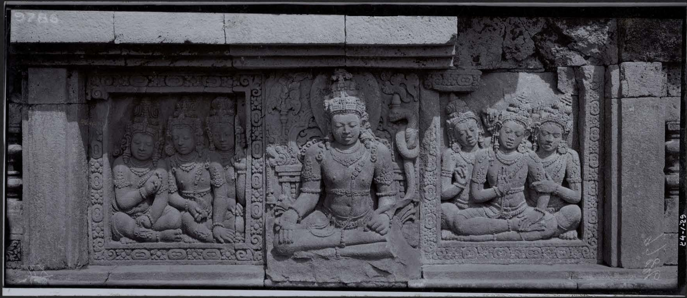
Série des 33 Dieux — Surya, Dieu du Soleil