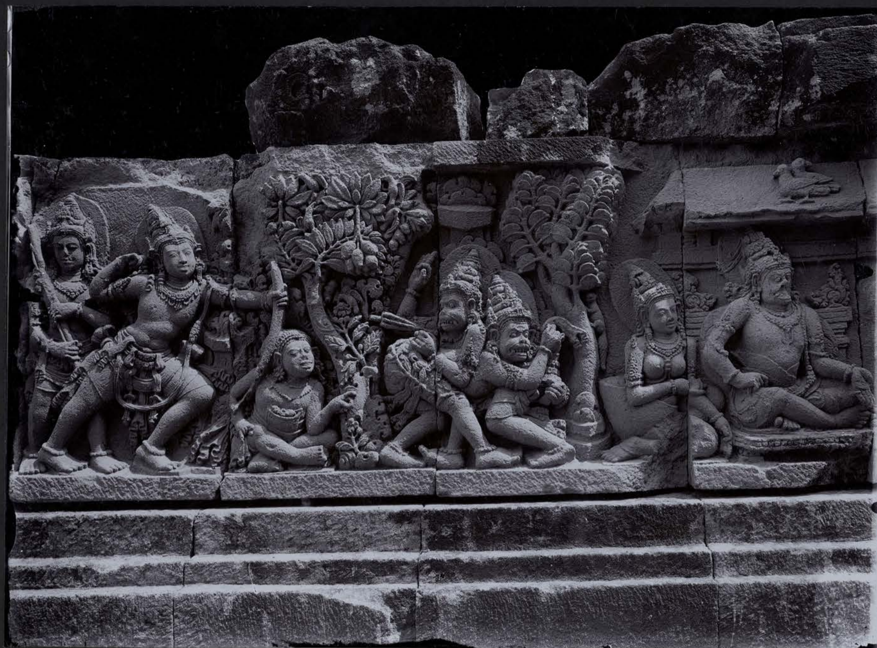
Temple de Prambanan