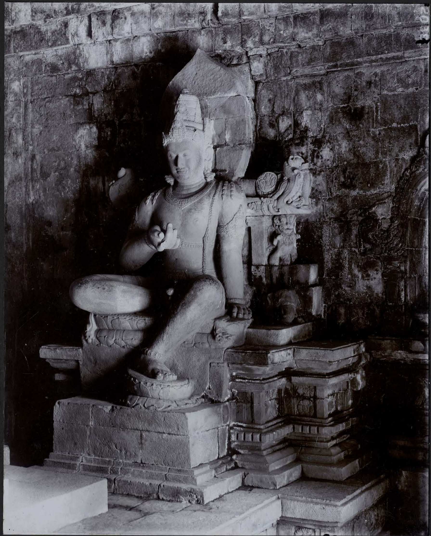
Le Bodhisattva Vajrapani