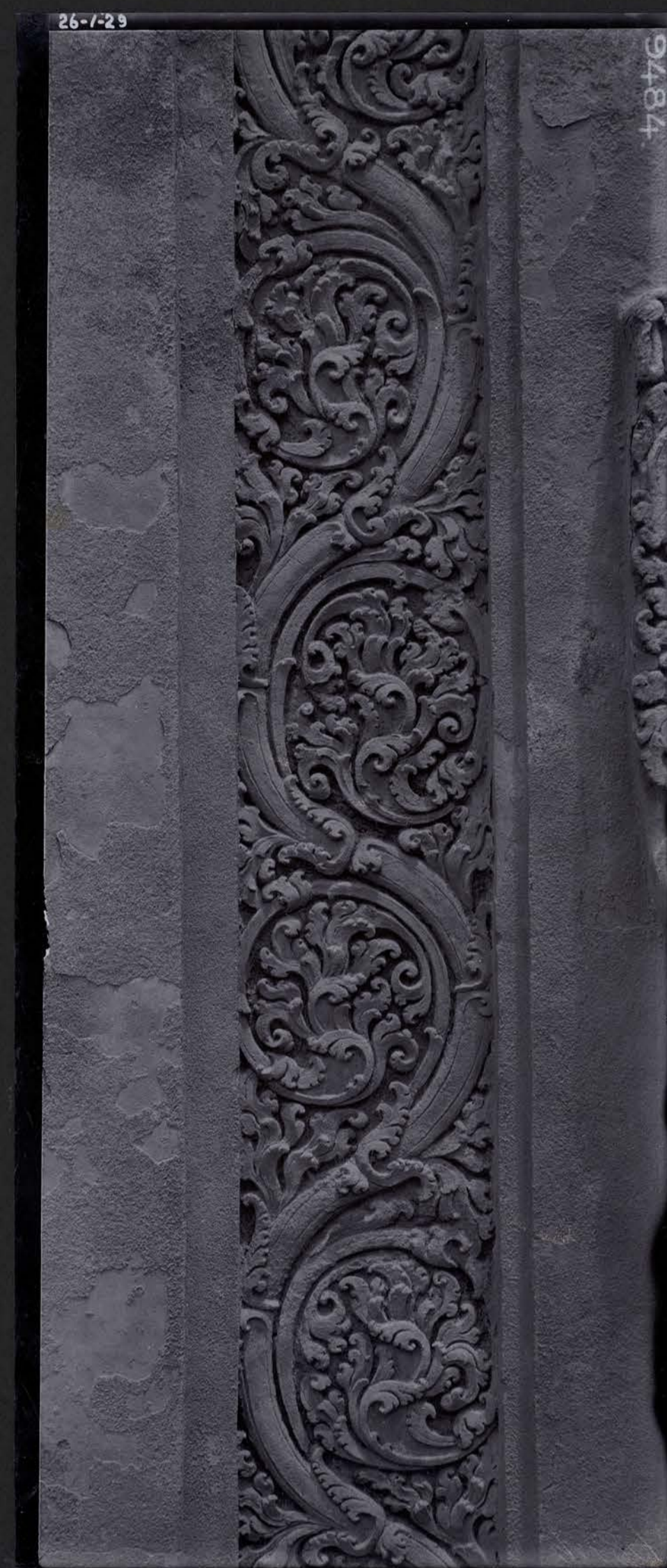
Détail d'ornement du Façade Méridional