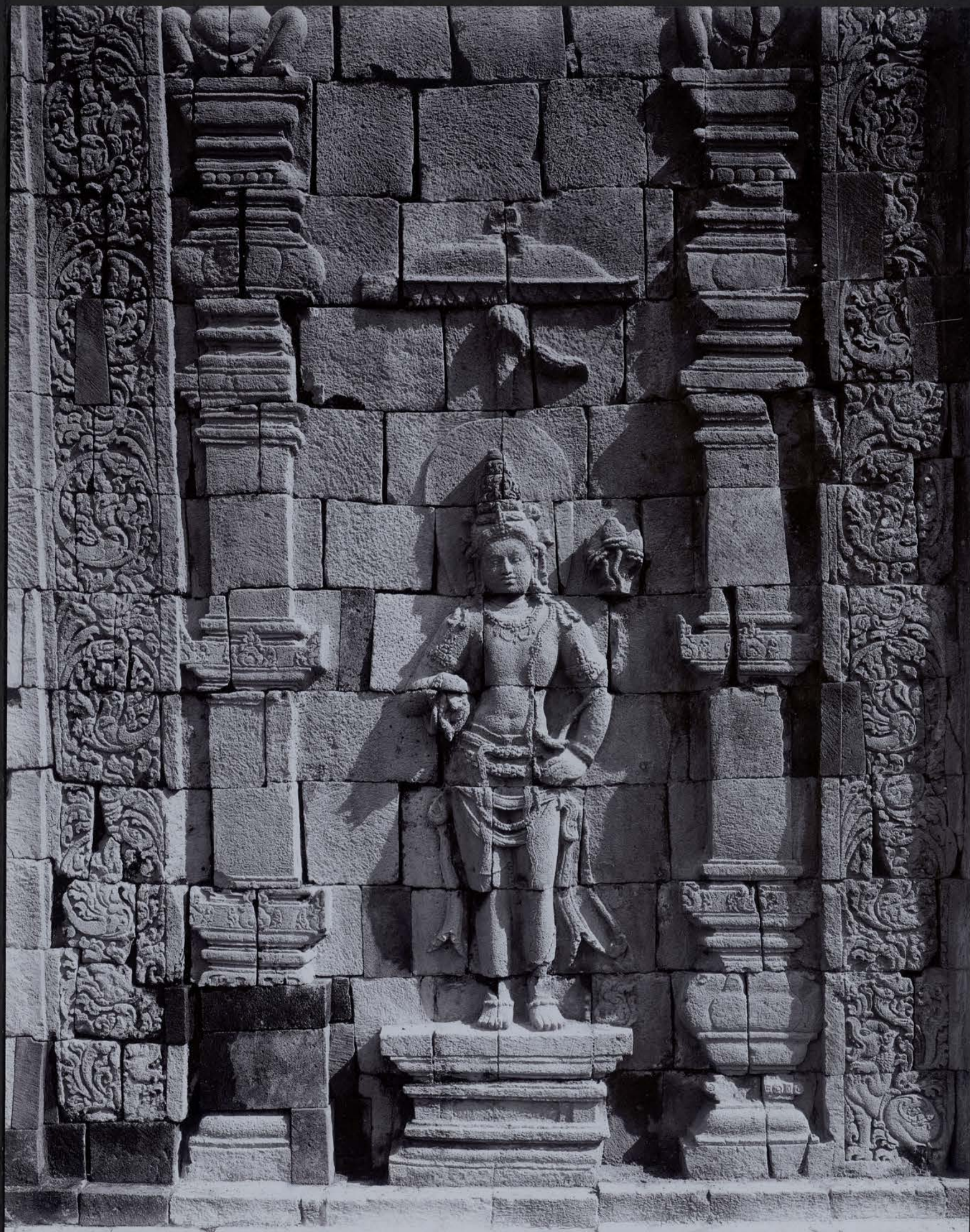
Le Bodhisattva Samantabhadra