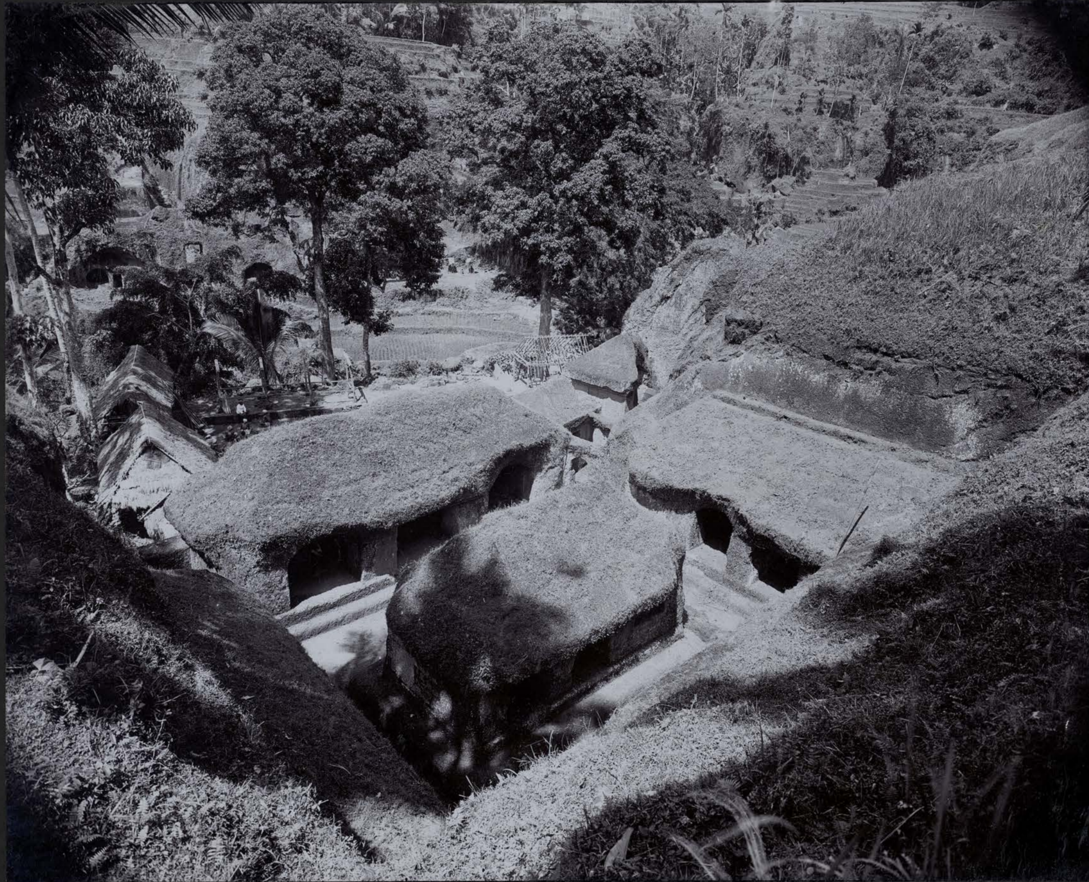
Monastère du Goenoeng Kawi ~ à vue d'oiseau