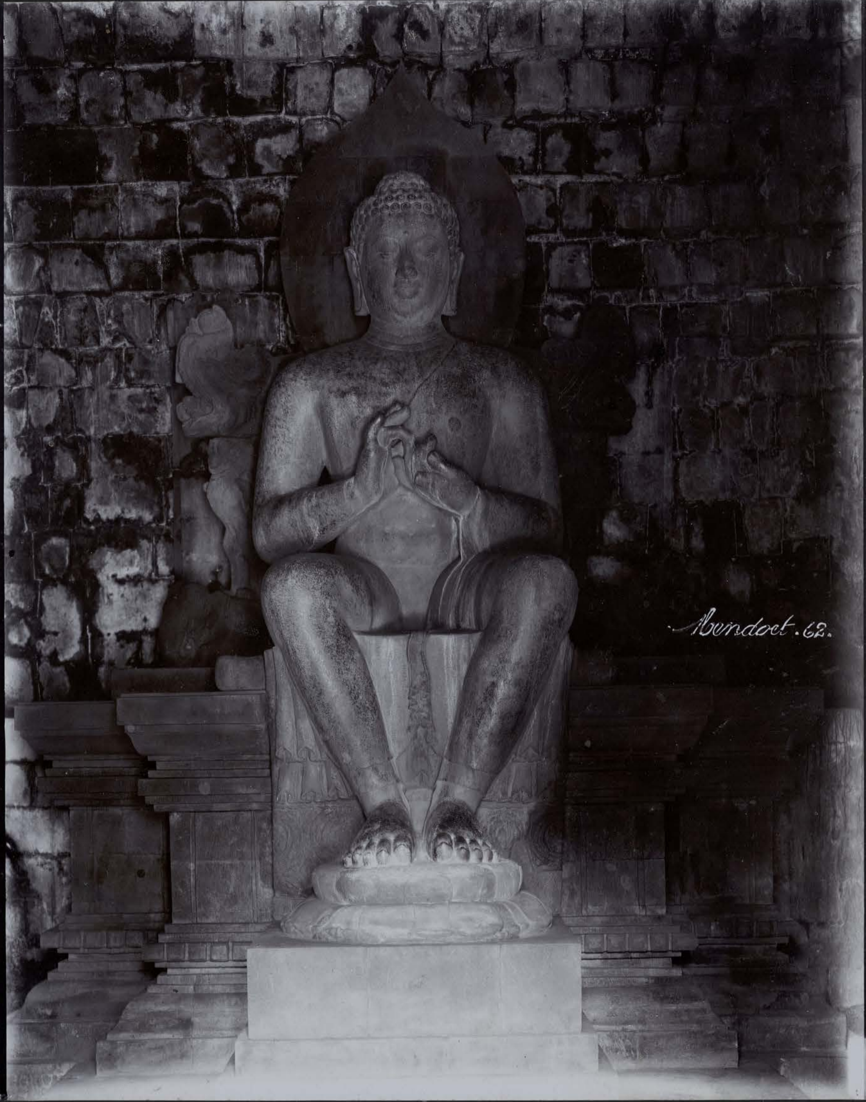
Le Bouddha prêchant