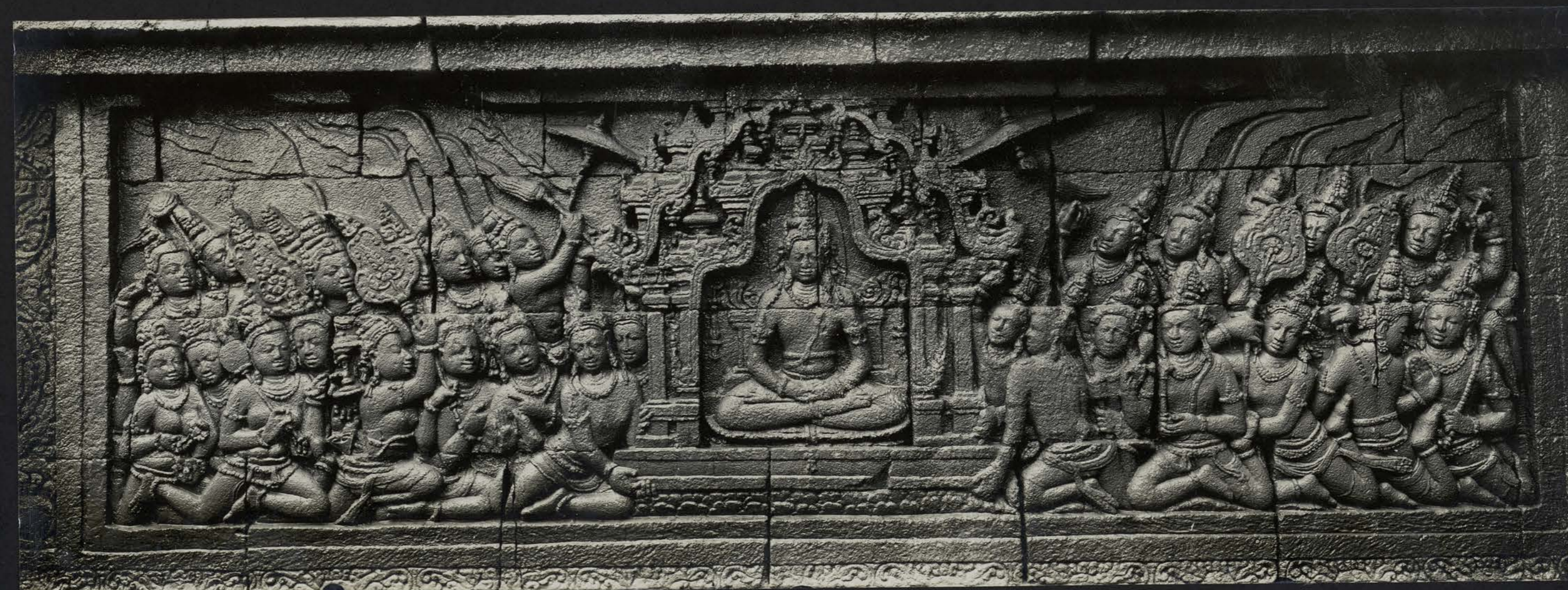
Descente du Bodhisattva