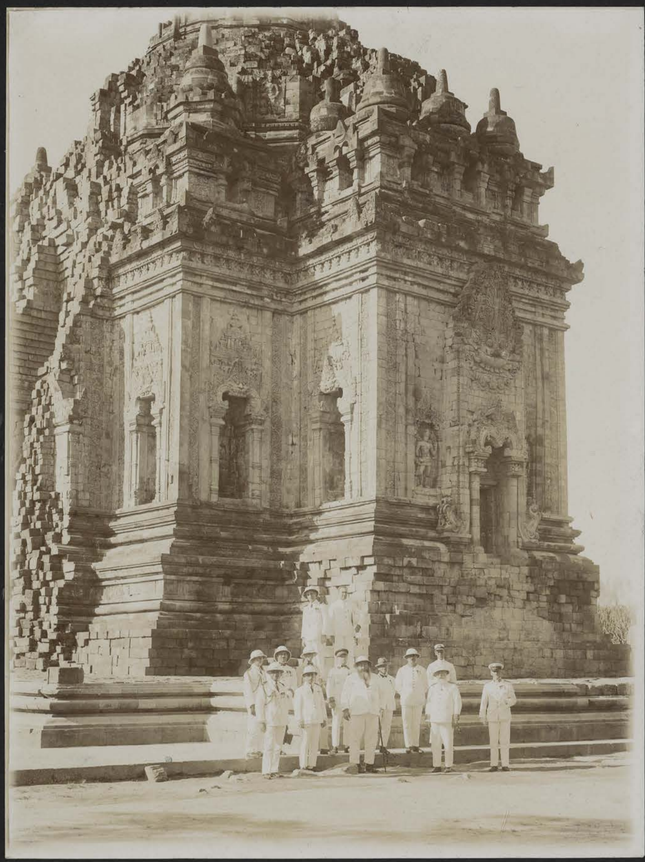
Visite de Son Excellence