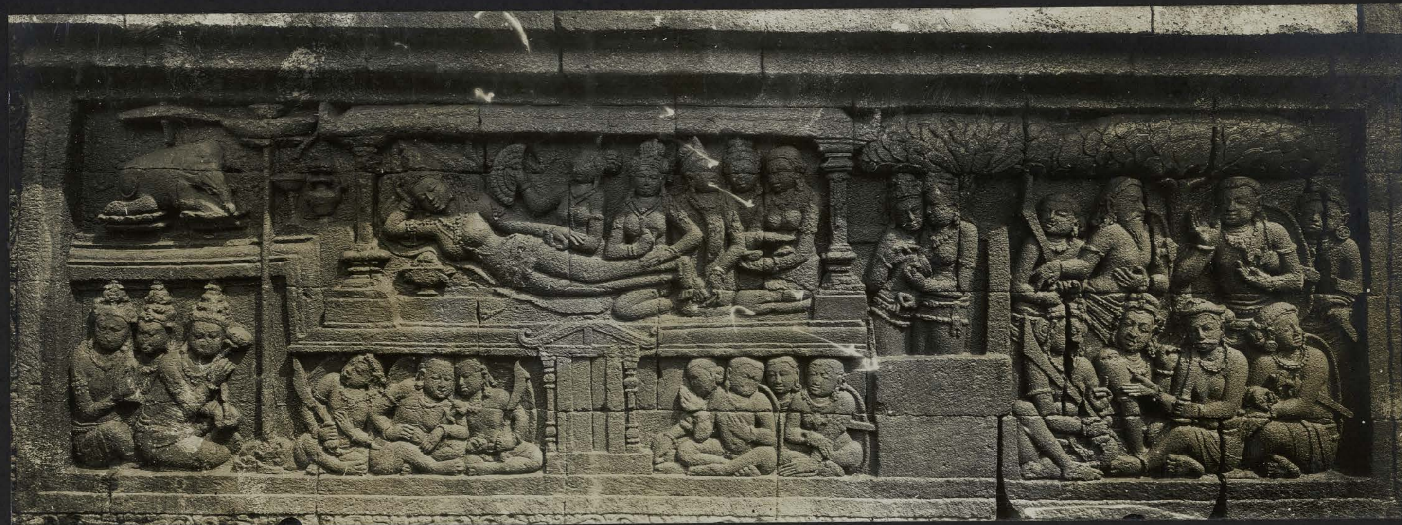
Le Bodhisattva entre dans le ventre de la Reine Māyā dans la forme d'Éléphant blanc