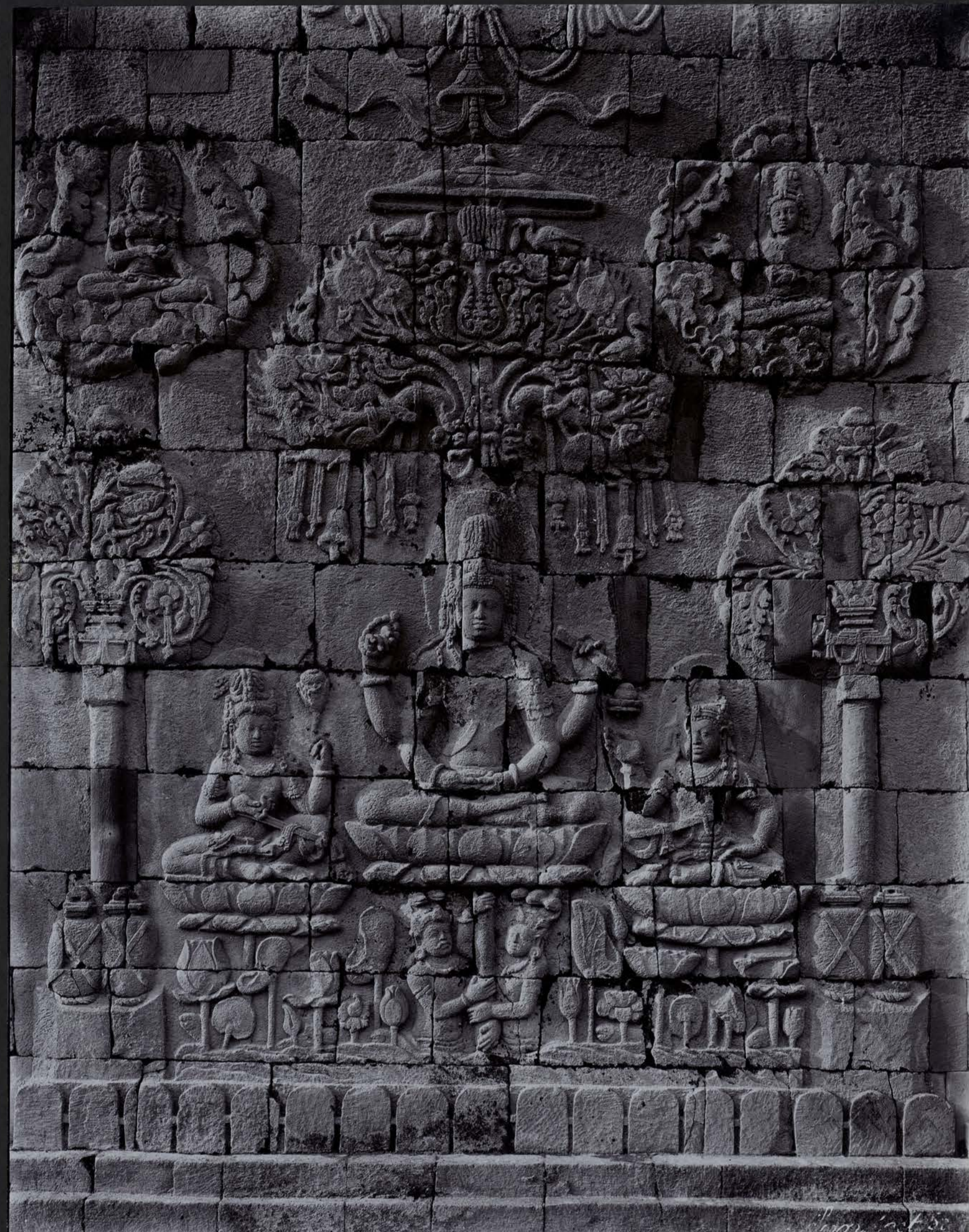
Le Bodhisattva Padmapani