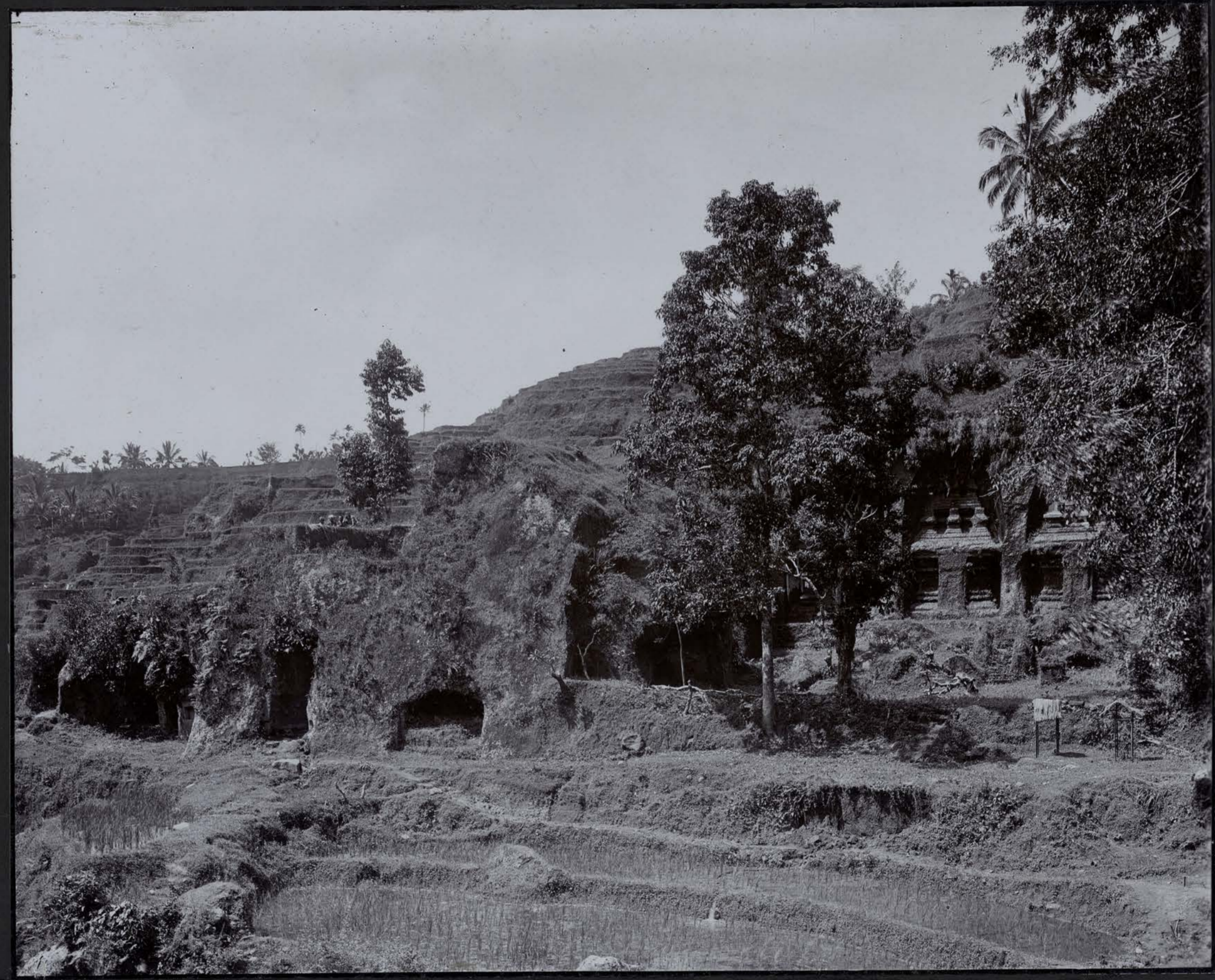
Monastère du Goenoeng Kawi — Les Tombes des Reines