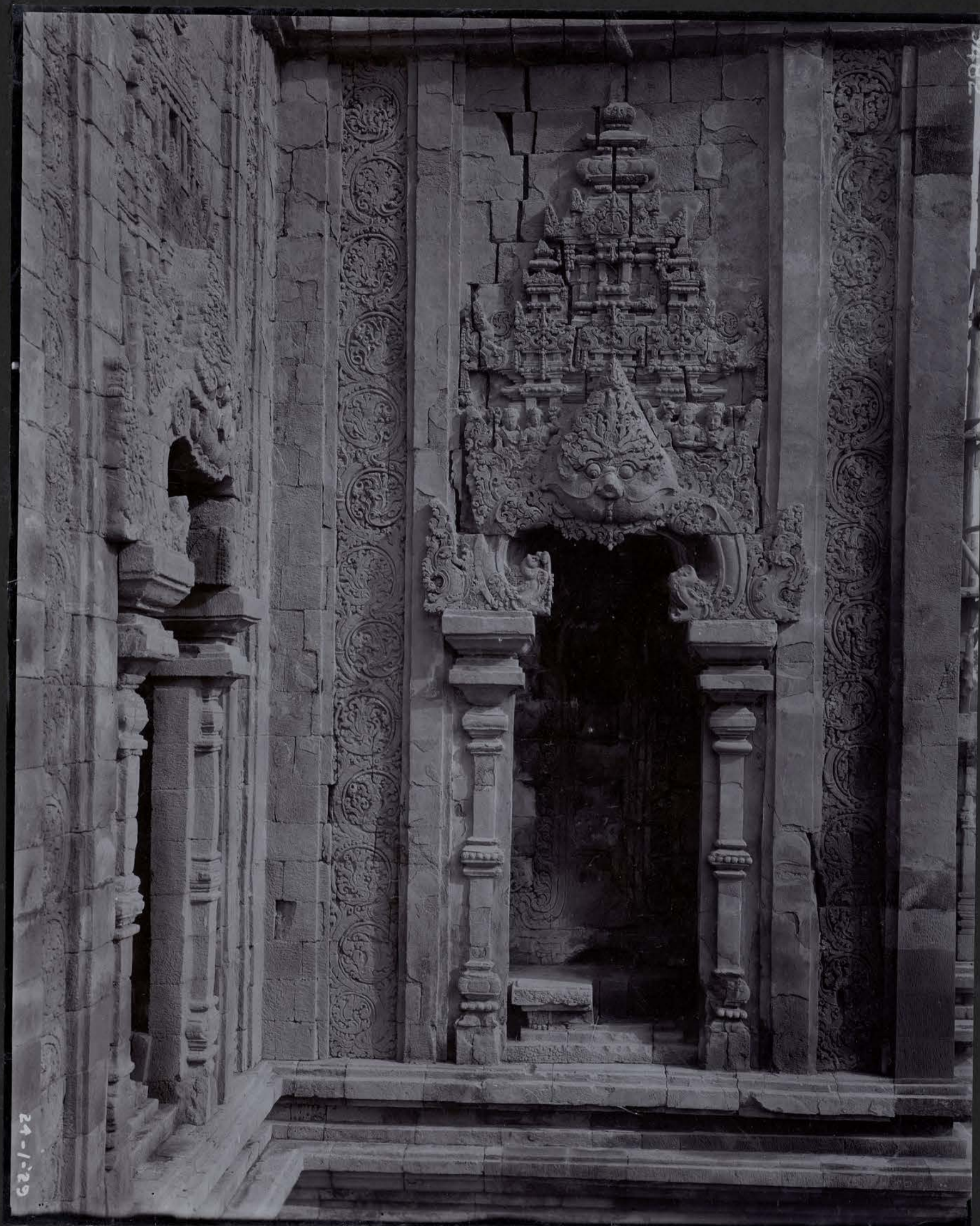
Détail du Façade Méridional