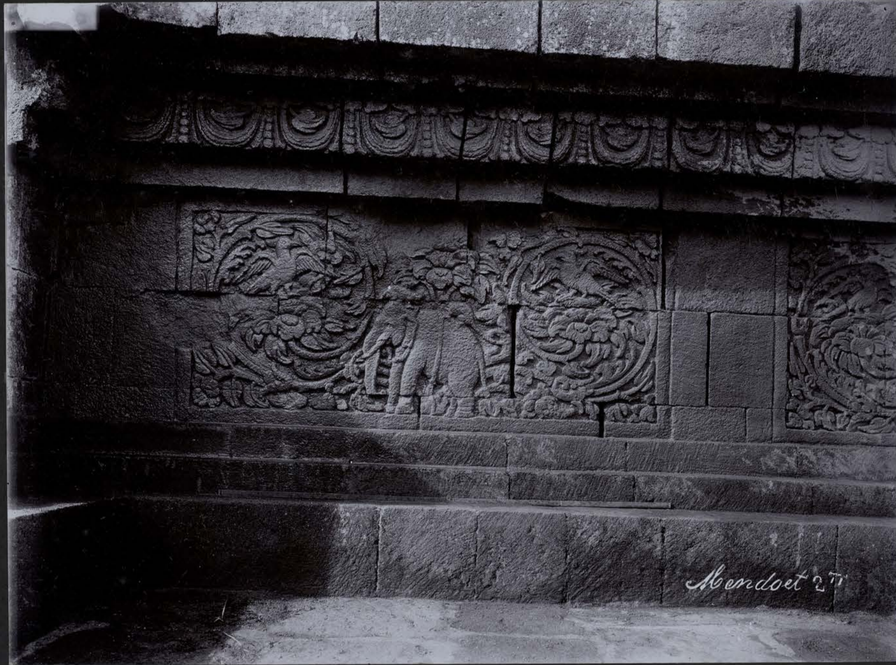
Jataka de l'Eléphant et du Souris