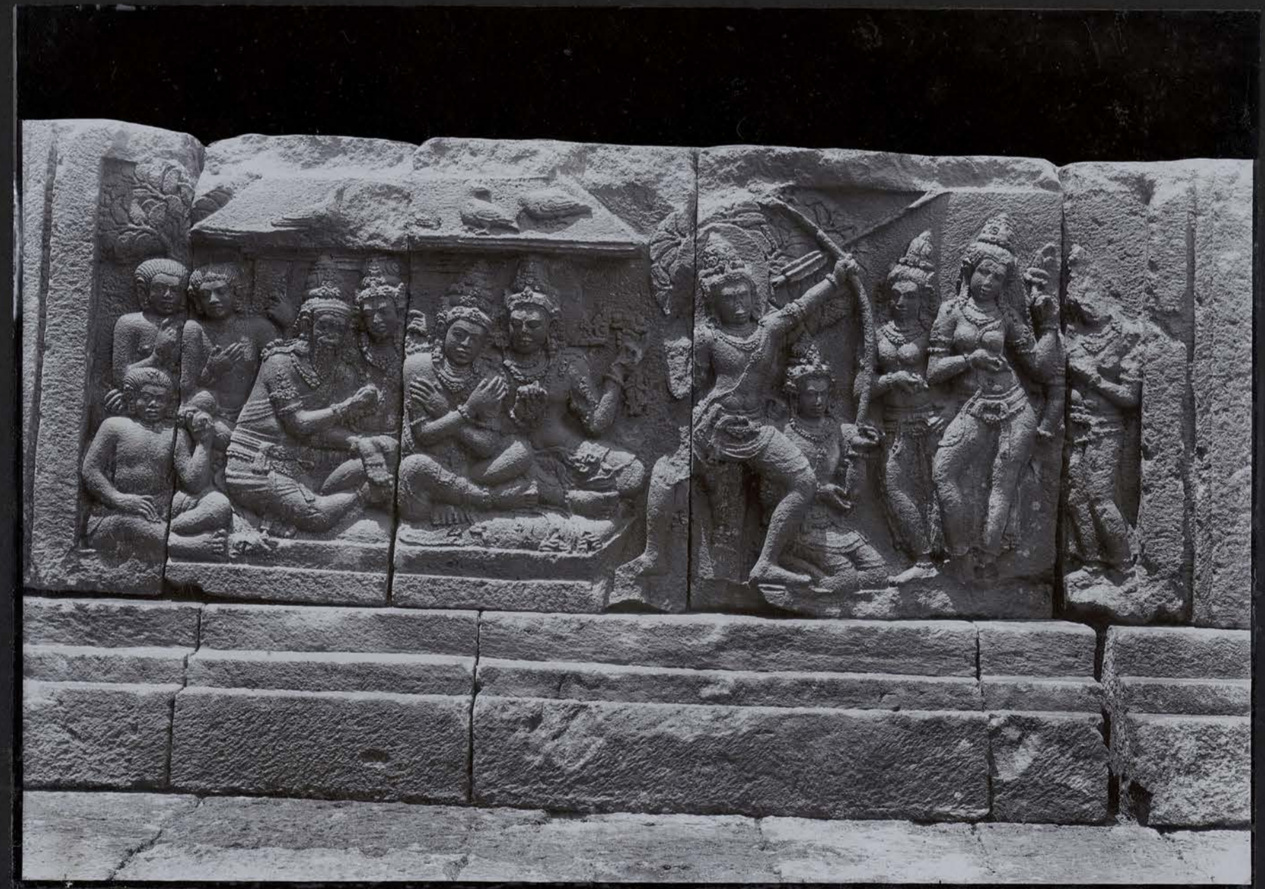
Série du Ramāyana — Le Svayambara du Sītā