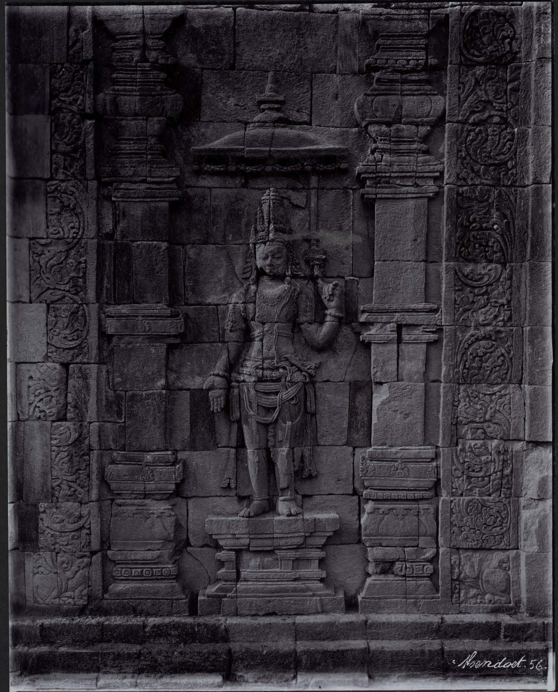
Le Bodhisattva Manjūśrī