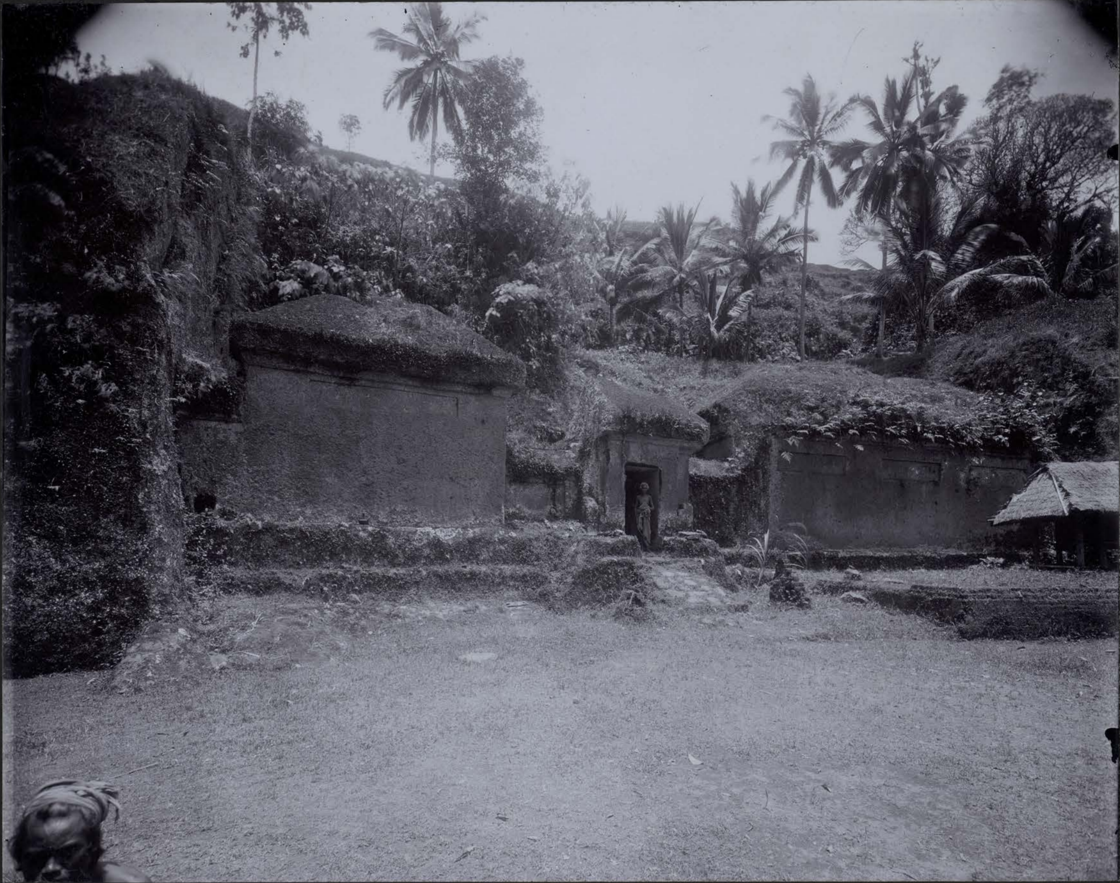
Monastère du Goenoeng Kawi — Entrée