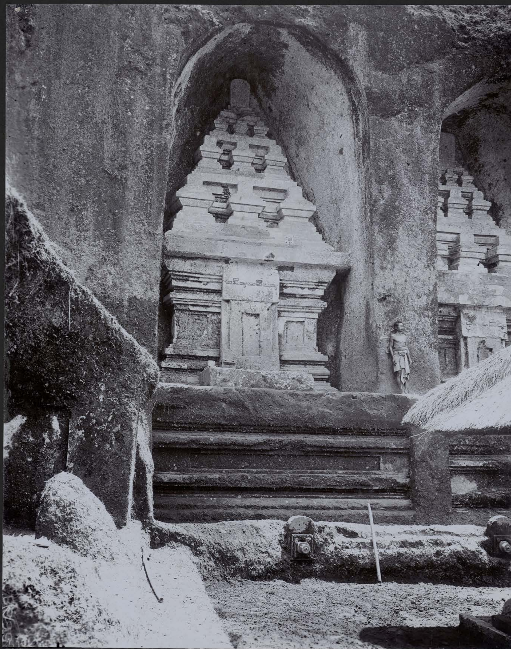
Monastère du Goenoeng Kawi — Le Tombeau du Roi