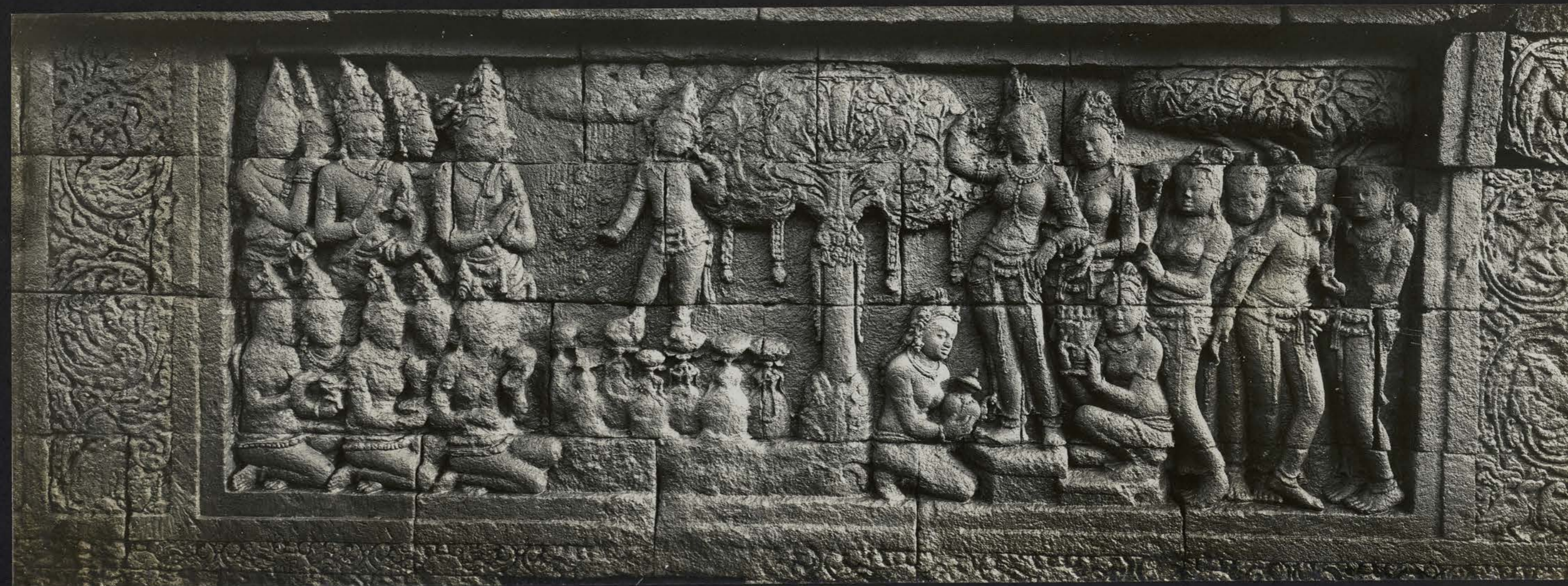
Naissance du Bodhisattva