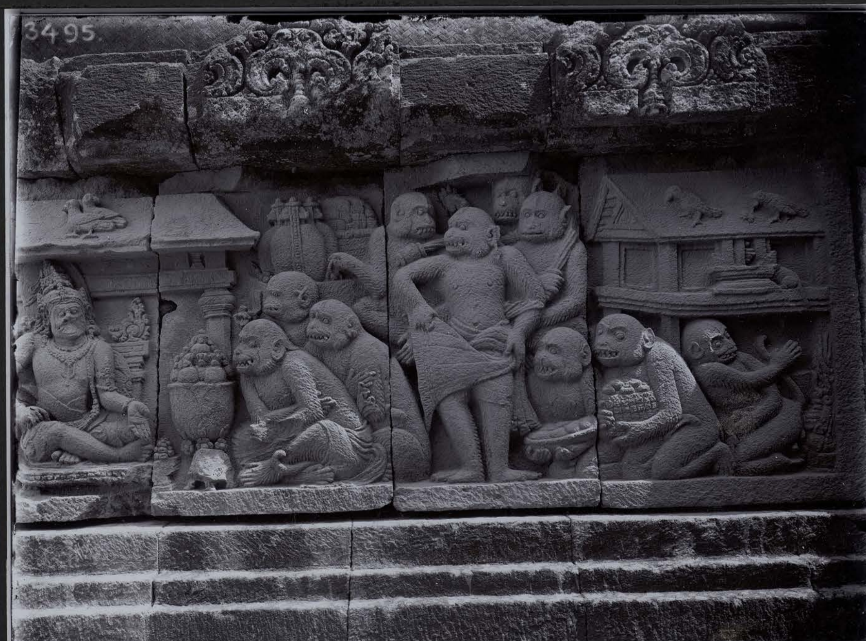
Série du Ramāyana — Couronation de Sugriva