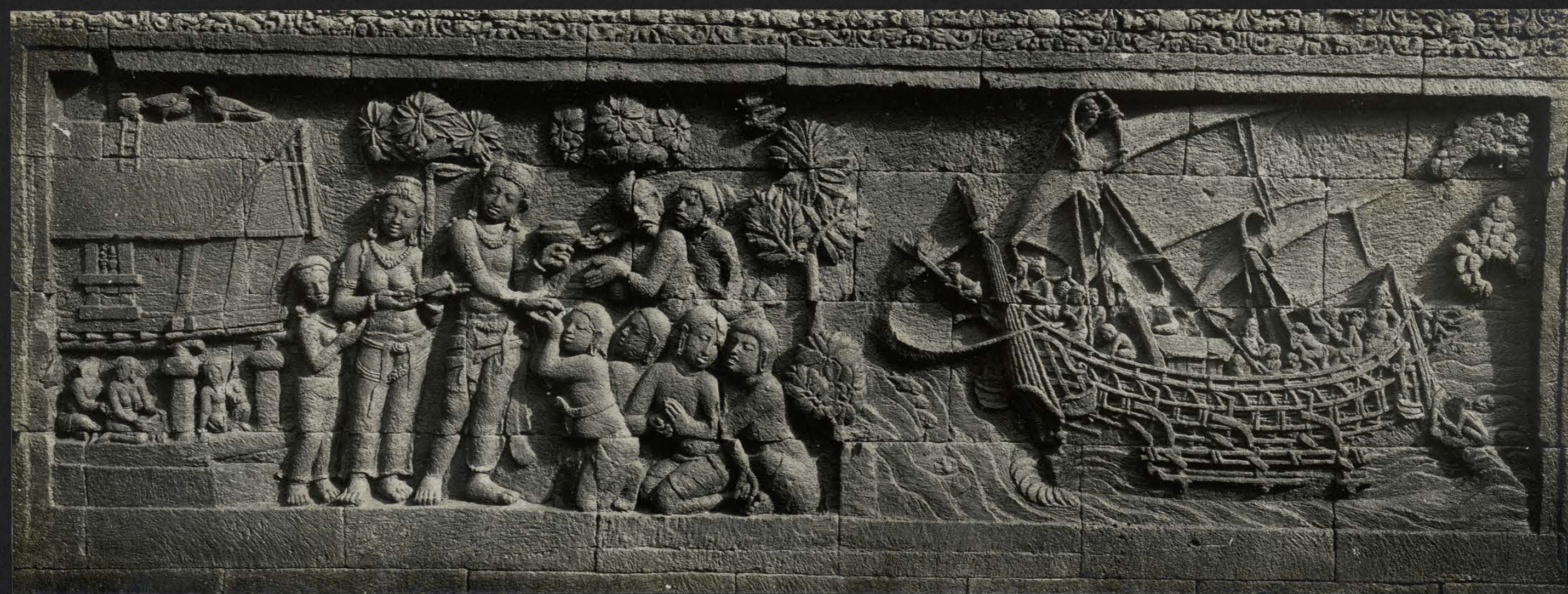
Scène inconnu du Série des Bas-reliefs du Divyāvadana