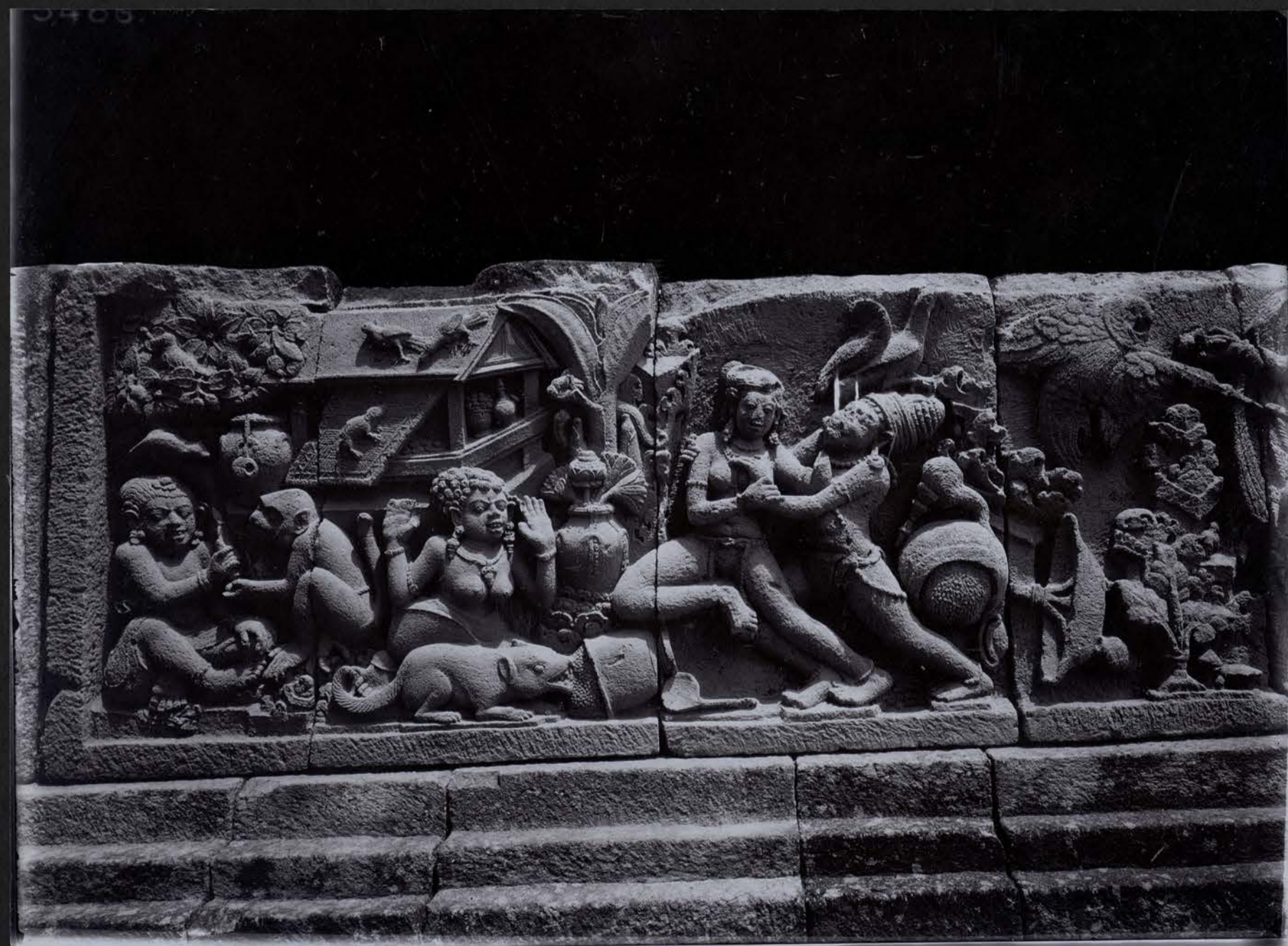
Série du Ramāyana — Enlèvement de Sītā