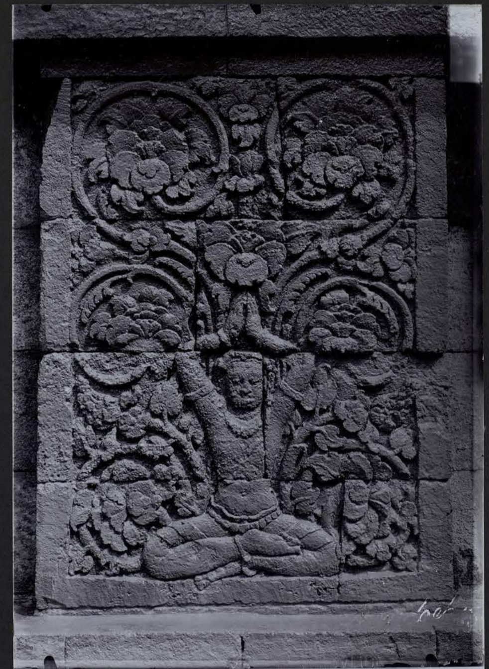
Détail du Soubassement du Façade Oriental