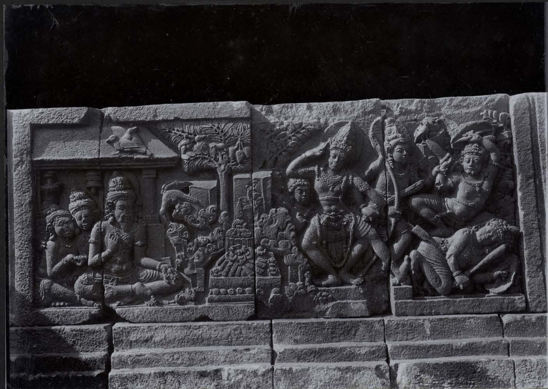
Série du Ramāyana — L'Anéantissement des Démones dans l'Hermitage de Viçyamitra