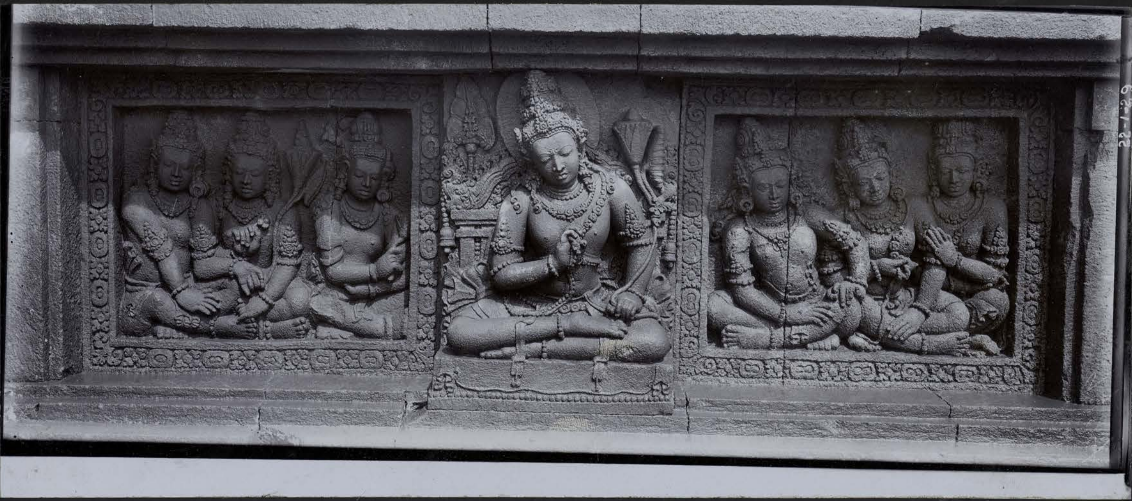
Série des 33 Dieux — Varuna, Dieu de la Mer