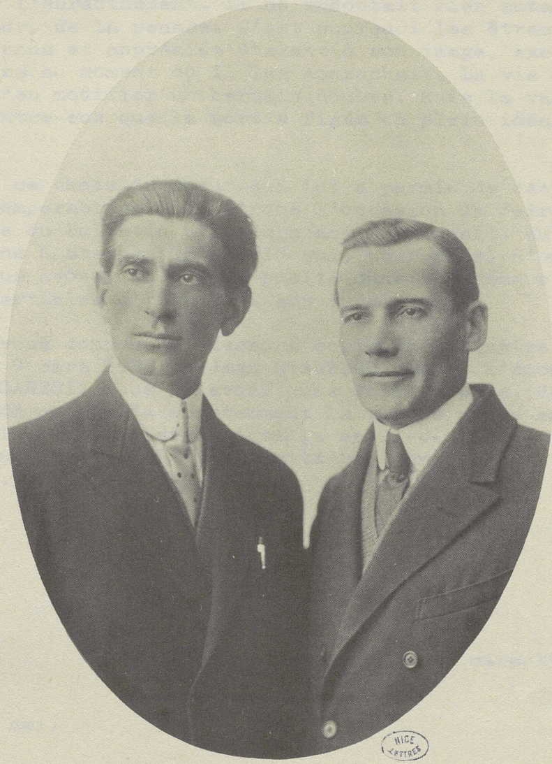
Panaït ISTRATI et Georges IONESCO